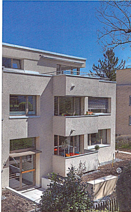
Der Eingangsbereich in frischem Look.