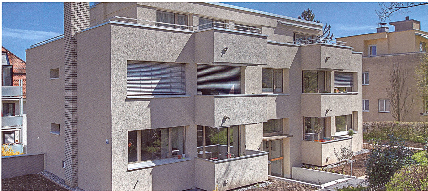
Das Mehrfamilienhaus am Schützenrain in Zürich wurde einer Gesamtsanierung unterzogen.

Nach 53 Jahren war es Zeit für eine Totalerneuerung: Mit einer neu gedämmten Gebäudehülle, neuen Fenstern und einer kompletten Innensanierung ist das Mehrfamilienhaus am Schützenrain in Zürich für die nächsten Jahrzehnte gerüstet.