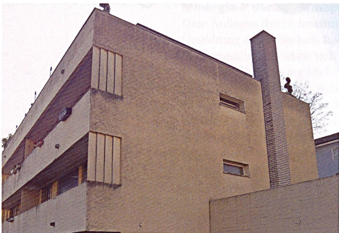
Die Fassade vor der Sanierung ...

Die Architekten von Choffat + Filipaj Architekten GmbH, Zürich, hatten den Auftrag, die Liegenschaft so zu erneuern, dass sie für mindestens 30 weitere Jahre unterhaltsarm weiterbetrieben werden kann. Wichtigste Massnahme dafür war die Dämmung der Gebäudehülle, inklusive Ersatz der Fenster. Damit lässt sich der Energieverbrauch massiv senken. Zugleich bringt die Neuerung mehr Komfort für die zuvor schwer heizbaren Wohnungen. Beim Material für die verputzte Aussenwärmendämmung setzten die Architekten auf