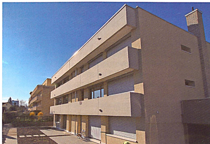
... und nach der Sanierung.