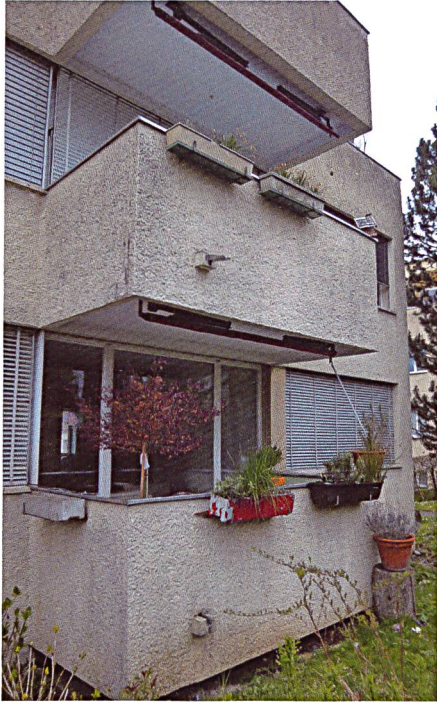
Auch die Balkons waren renovierungsbedürftig.