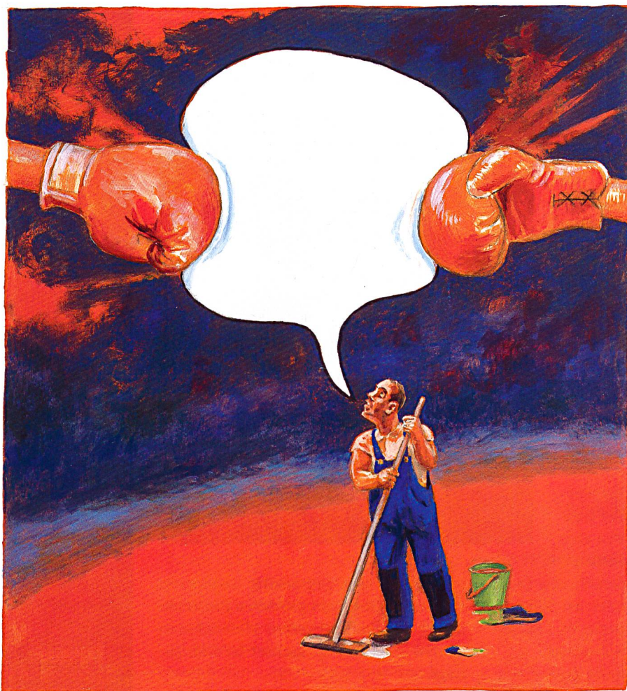
Illustration: Monika Zimmermann

Der Hauswart (oder die Hauswartin) braucht nicht nur handwerkliches Geschick... (siehe Kurs am 7. Mai 2019 in Zürich und am 1. November 2019 auch wieder einmal in Bern).