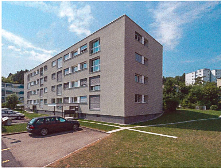
Gesamtsanierung MFH Am Brunnenbächli in Zollikerberg

Liegenschaftsanalysen Generalplanungen Bauleitungen