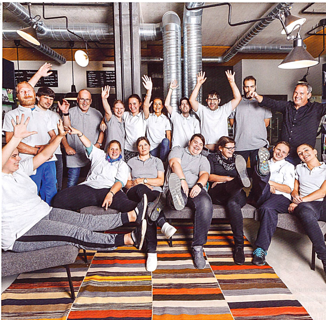
Auf dem Areal Zwicky Süd von Kraftwerk1 betreibt die Stiftung Altried mit grossem Erfolg vier betreute Wohngruppen sowie das Bistro und Hotel «ZwiBack», das von einem gemischten Team betrieben wird.