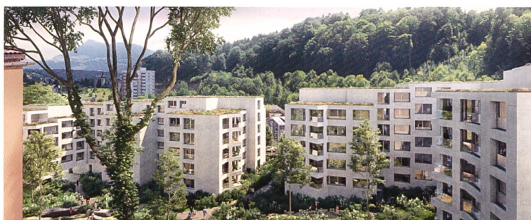
Zur Überbauung Bernstrasse gehört auch eine Parkanlage.

Die Mitglieder der Allgemeinen Baugenossenschaft Luzern (ABL) haben an der Urabstimmung mit über 93 Prozent Ja-Stimmen den Rahmenkredit von 37,5 Millionen Franken für die Neubauten an der oberen Bernstrasse angenommen. Die Siedlung entsteht gemeinsam mit der Baugenossenschaft Matt Luzern und verfügt über insgesamt 142 Wohnungen (davon 80 ABL)