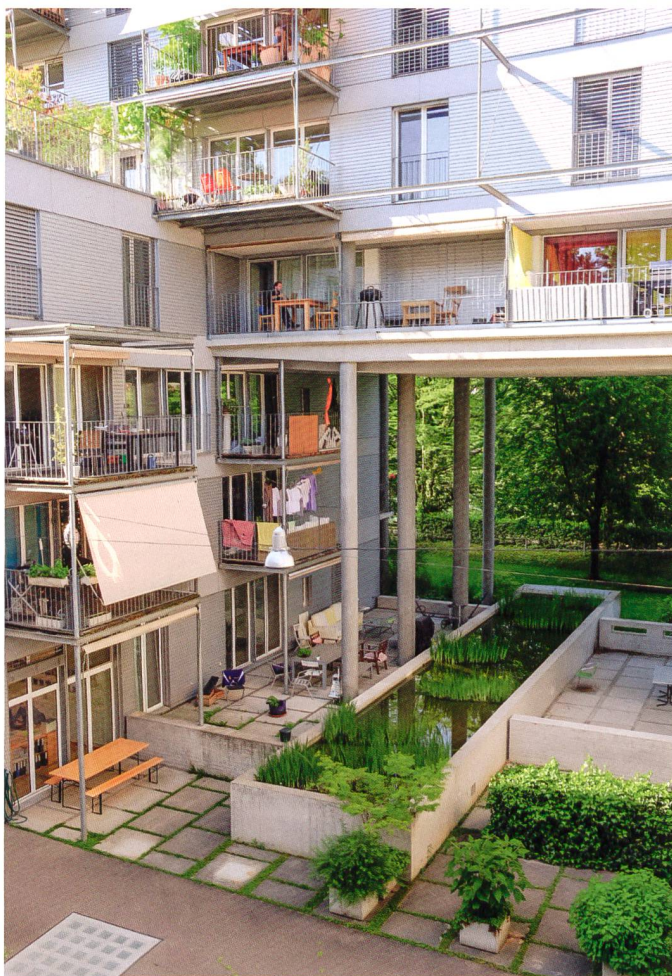
2 Beispiel einer sorgfältigen Gestaltung der Übergänge zwischen öffentlichen und privaten Sphären (Limmatwest in Zürich, Hardturm Immobilien AG).

Dichte ist in aller Munde. Es scheint ein Konsens darin zu bestehen, dass wir mit der Ressource Boden sparsamer umgehen sollten. In der Umsetzung allerdings sieht die Sache anders aus. Die meisten jedenfalls sind nur dann einverstanden zusammenzurücken, wenn sie sich in ihrer Privatsphäre nicht eingeengt fühlen. Das ist verständlich und aus der eigenen Erfahrung bekannt.