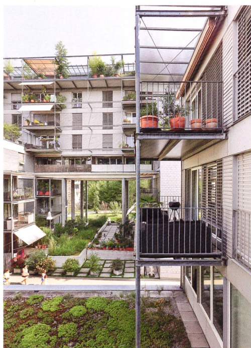
5 Das inszenierte Wechselspiel von eng und weit findet seinen Höhepunkt im Flussfenster, das die Aufmerksamkeit so in Anspruch nimmt, dass der Blick von den einzelnen Wohnungen abgelenkt wird (Limmatwest).

sammenhang mit fehlenden Rückzugsmöglichkeiten erst während des Betriebs. Deshalb ist es essenziell, dass solche Grenzziehungen zwischen öffentlich und privat nicht starr und unveränderlich sind und das Verhältnis zwischen Rückzug und Gemeinschaft graduell verändert oder neu austariert werden kann.