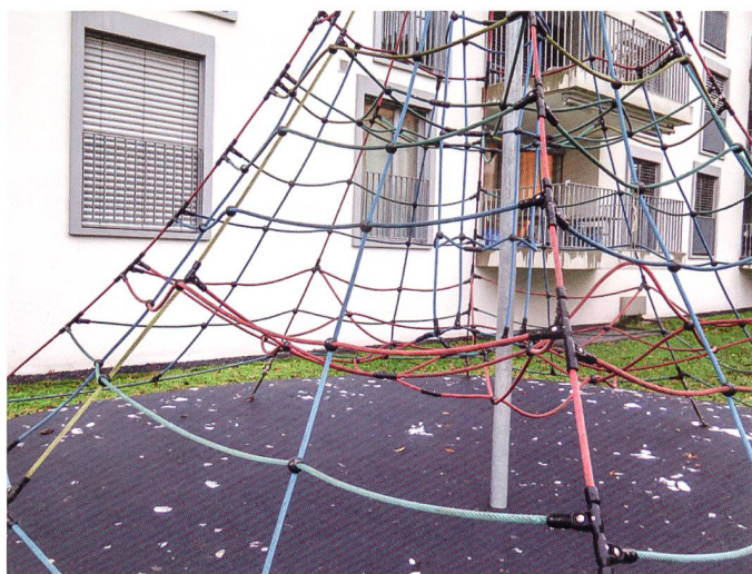
3 Hier fehlt ein räumlicher Übergang zwischen öffentlicher und privater Nutzung (Herti 6 in Zug, Korporation Zug).