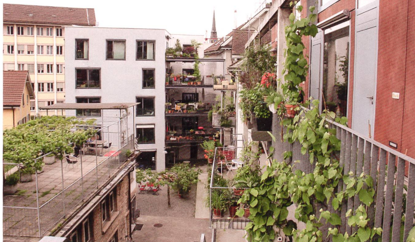
4 Die poröse Bebauungsstruktur mit niedrigen Hofbauten, unterschiedlichen Baulücken, Vor- und Rücksprüngen erzeugt auf kleinem Raum eine abwechslungsreiche Abfolge introvertierter und extrovertierter Aussenräume (Dreieck in Zürich, Genossenschaft Dreieck).