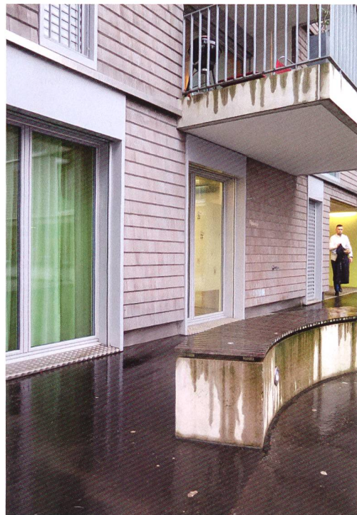
6 Schwierig wird es für Mietende, wenn ihnen die Gestaltung keine Rückzugsmöglichkeiten erlaubt und es gleichzeitig verboten ist, selber Abhilfe zu schaffen (Herti 6).

Voraussetzung dafür sind sowohl die Architektur als auch eine Hausordnung, die solche Aushandlungen und entsprechende Anpassungen ermöglicht. In welchem Masse gibt die Wohnarchitektur den Bewohnenden Möglichkeiten an die Hand, Rückzug und Austausch individuell steuern zu können? Wie nehmen die Bewohnenden ihr Umfeld, ihre Wohnsituation und ihre Spielräume zur Regulierung von Austausch und Rückzug konkret wahr? Mit diesen Fragen in der Tasche machte sich das Forschungsteam auf den Weg zu neun ausgewähl-