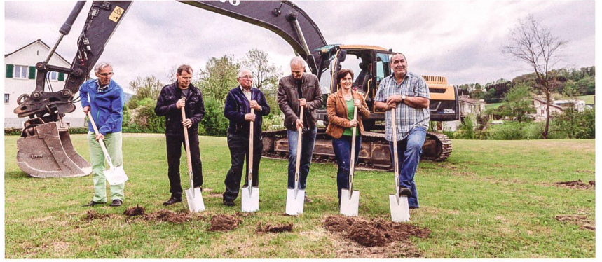
15 altersgerechte Wohnungen und einen attraktiven Gemeinschaftsraum erstellt die Genossenschaft Wohnen an der Lüssel in Brislach (BL). Im Herbst 2019 ist voraussichtlicher Bezug. Dank grosser Solidarität im Dorf kann das 6-Millionen-Projekt mit einer Bankfinanzierung von nur gut fünfzig Prozent realisiert werden. Rechts: Spatenstich am 26. April 2018.

anderen zusätzliche Pflichtanteilscheine (Depot in Verbindung mit den Wohnungen). Besonders erfolgreich waren die Initianten/-innen beim Sammeln privater Darlehen. «Wir haben überall im Dorf breit Werbung gemacht und auch dank Mund-zu-Mund-Propaganda