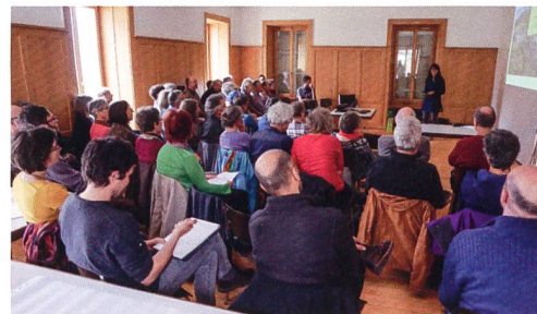
In Almens im bündnerischen Domleschg will die Wogeno Pumera 22 Wohnungen erstellen. Das Projekt des renommierten Architekten Gion A. Caminada fügt sich in die traditionelle Architektur im Ort ein. Bei der Finanzierung nutzt die Wogeno Pumera auch die Bundeshilfen sowie die Mittel aus dem Solidaritätsfonds von WBG Schweiz. Bilder: Modell des Projekts von Architekt Caminada (links), Bauparzelle am nördlichen Dorfrand von Almens (rechts oben), Gründungsversammlung vom 11. Januar 2016 (rechts unten).

Hintergrund dieser Kreditpolitik sind die Richtlinien für grundpfandgesicherte Kredite. Nach den von der Finanzmarktaufsicht (Finma) für verbindlich erklärten Mindeststandards muss sich die Bank rein am Ertragswert einer Liegenschaft orientieren. Kommt noch dazu, dass heute eine strenge und regelmässige Prüfung aller Kreditrisiken zwingend vorgeschrieben ist. So hat zum Beispiel die ZKB die Eigenkapitalanforderungen bei Mehrfamilienhäusern noch einmal leicht verschärft, wie eine Sprecherin bestätigt. «Aufgrund von zunehmenden Leerständen wird der Mietwohnungsmarkt von Banken, der Finma und der Schweizerischen Nationalbank (SNB) gut beobachtet», so der offizielle Wortlaut.