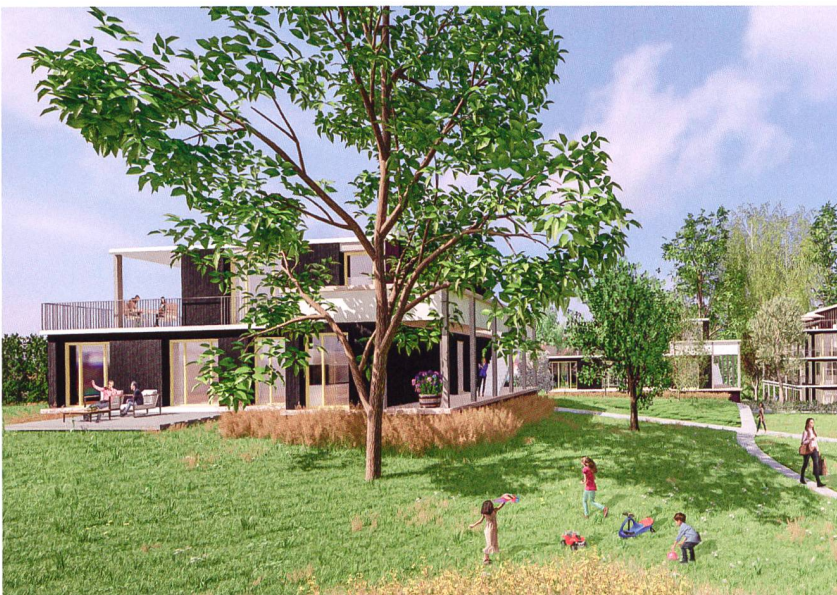
Die Genossenschaft für Wohnkultur erstellt in Muri (AG) 37 Genossenschafts- und 17 Eigentumswohnungen, die diesen Frühling fertigwerden. Bei der Finanzierung war die Starthilfe einer Partnerunternehmung wichtig; zudem setzte man auf Förderdarlehen aus dem Fonds de Roulement und dem Solidaritätsfonds.

Wenn etwa die Gemeinde einen Beitrag spricht, wirkt dies enorm vertrauensfördernd. Weiter leistete das erste Mietinteressentenpaar eine grosse Hilfe mit einer Schenkung. So viel Solidarität brachte die Genossenschaft schliesslich in die komfortable Lage, die Wahl einer Bank und auch die Höhe des Fremdkapitalanteils selbst gestalten zu können. Gemäss dem aktuellen Stand beträgt der Anteil der Bankfinanzierung nur gut fünfzig Prozent. Streng genommen sind aber auch die Darlehen von Dritten, von der öffentlichen Hand usw. als Fremdkapital zu werten und nicht als Eigenkapital. Summa summarum steht das Projekt damit aber finanziell auf einem soliden Fundament. Der Bezug der Wohnungen ist auf den Herbst 2019 angesetzt.