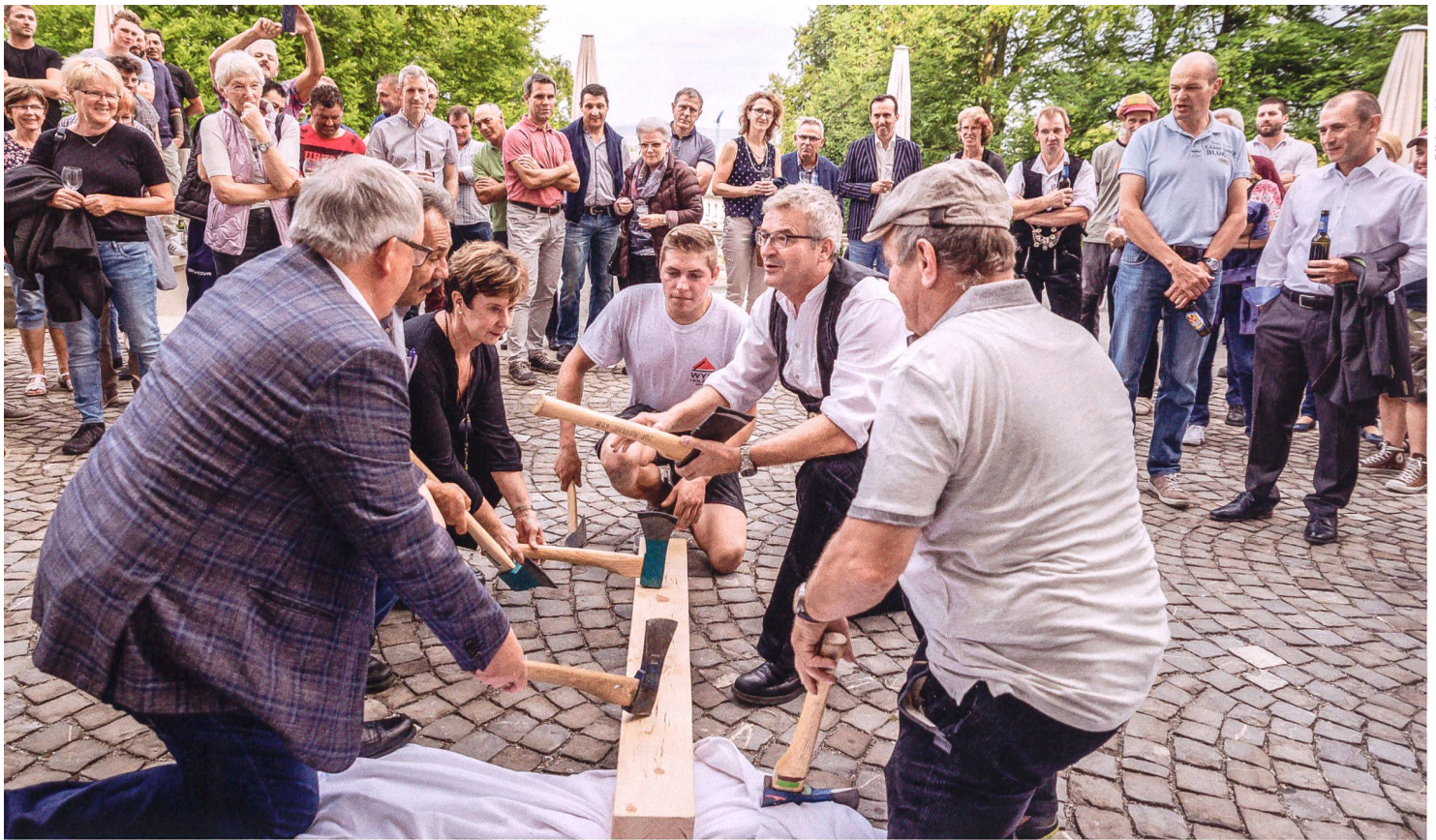
Bis eine junge Genossenschaft den Spatenstich oder gar die Aufrichte feiern kann, muss sie die Finanzierung ihres Projekts sicherstellen – oft kein einfaches Unterfangen. Bild: Aufrichtefeier bei der Genossenschaft für Wohnkultur in Muri (AG).

Wie finanzieren neu gegründete Baugenossenschaften ihre Projekte?