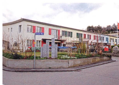
Blick ins «Birchermüesliquartier» mit den typischen Kreuzreihenhäusern.