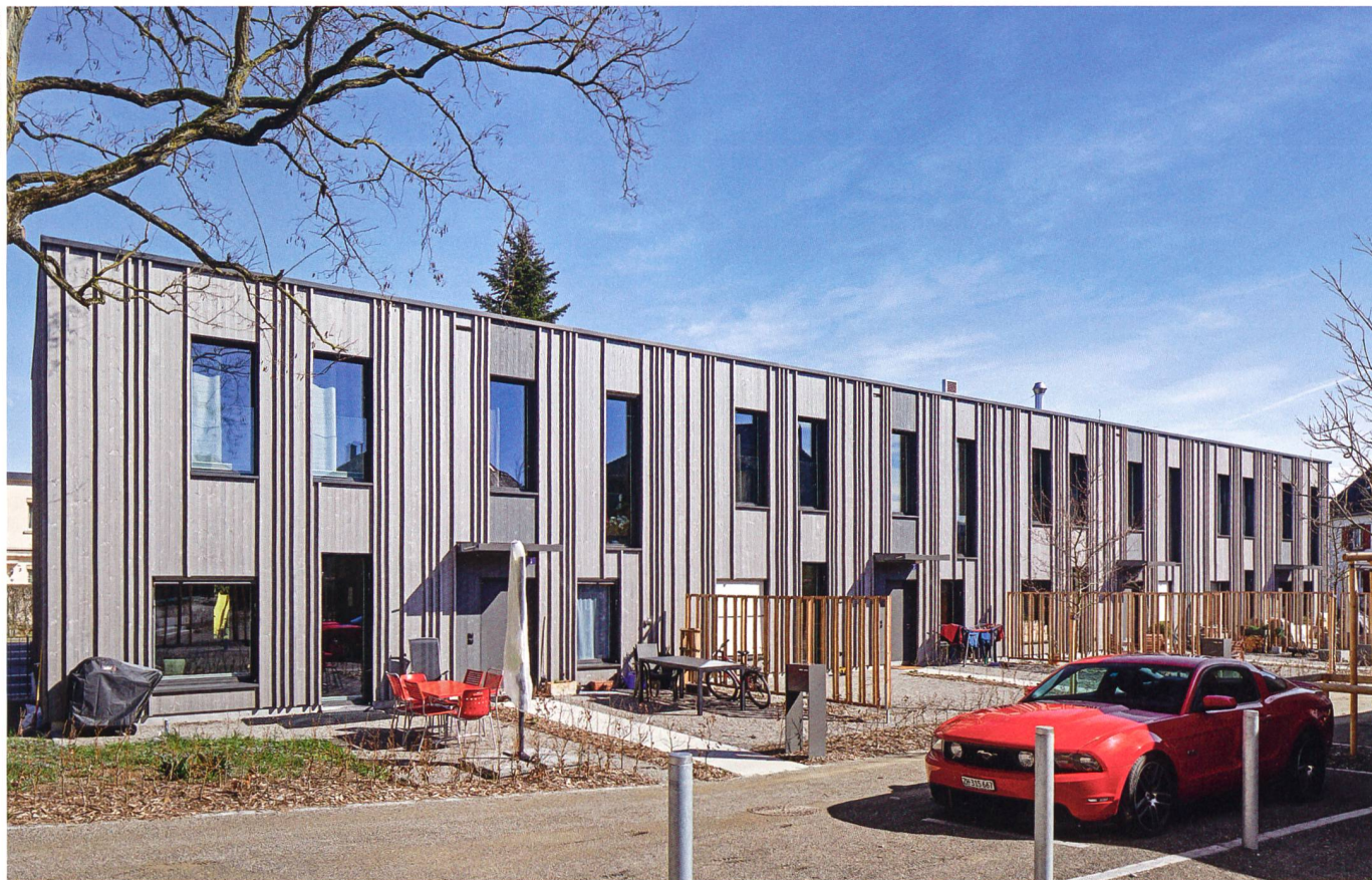
Die acht Häuser messen gerade mal je 4,5 Meter in der Breite.

Heimstätten-Genossenschaft Winterthur (HGW) erstellt Reihenhauszeile