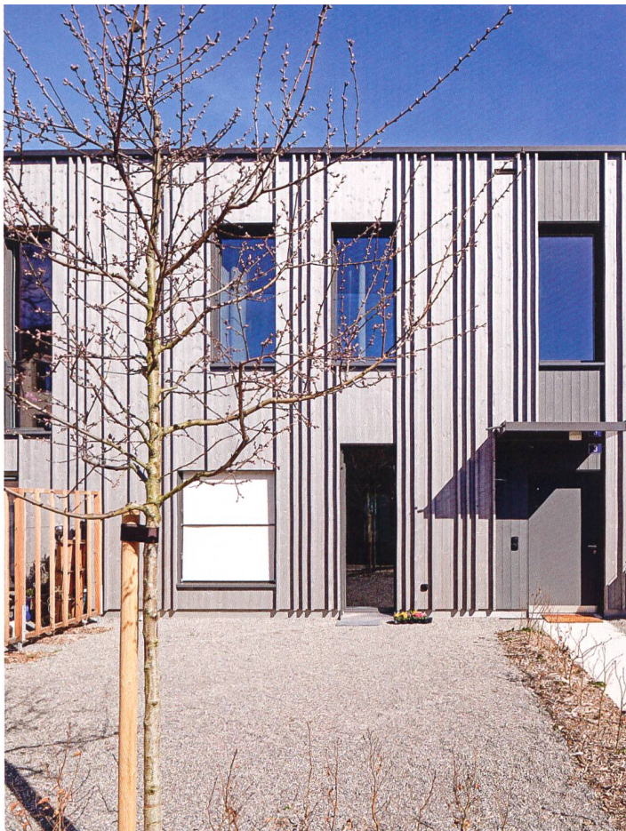
Dank den alternierenden Hauseingängen auf der Ost- und der Westseite wirken die individuellen Aussenräume grösser.