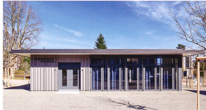
Der neue Quartiertreff steht dem ganzen Stadtrainquartier zur Verfügung.

hen vom massiven Sockel besteht der Baukörper ganz aus Holz. Die Fassade kommt in einer vorvergrauten Verschalung mit vertikalen Holzleisten daher, die eine reliefartig bewegte Oberfläche erzeugen. Die Wärmeenergie liefert eine Erdsonde. Auf dem Dach hat man eine Photovoltaikanlage installiert, wobei die HGW an diesem Standort erstmals das Modell der Eigenverbrauchsgemeinschaft austestet. Die Vermietung der Häuser bereitet keinerlei Probleme – ein Beweis dafür, dass die Reihenhausstrategie der Genossenschaft hier genau richtig war.