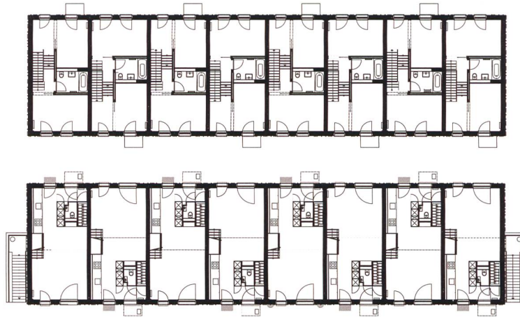
Grundrisse Erdgeschoss (unten) und erstes Obergeschoss.