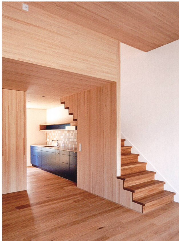
Die Häuser erstrecken sich über die ganze Länge. Grosse Fenster und teils höhere Räume sorgen für ein grosszügiges Wohngefühl.