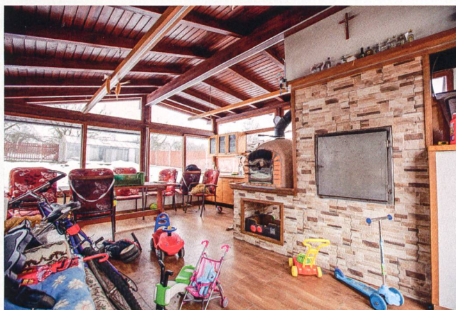
Haus und Familie vor dem Hauseingang, Wohnzimmer, Essbereich in der Küche (2005).