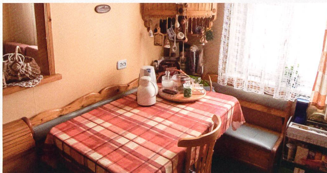
Bewohner vor dem Hauseingang, Lieblingsecke und Essplatz in der Küche (2005 und 2017).

richtungen angepasst wurden. Wir hören, wie sich Eltern beruflich weiterentwickelt und ihre Zeit nach der Phase der Kindererziehung gestaltet haben. Wir folgen ihren Kindern und den ehemaligen Mitbewohnerinnen in ihre eigenen Haushalte und beobachten dort familiäre und kulturelle Prägungen. Über die Wohnverhältnisse erfahren wir zudem, wie sich deren Umfeld verändert hat. 2005 – Osteuropa im Umbruch – sahen wir die Wohnbilder und Wohngeschichten als Momentaufnahmen und meinten, dass sie durch ständige Veränderungen Teil des historischen Prozesses sind. 2017 berichten uns die Autorinnen und ein Autor aus jedem Land, wie sie die Veränderungen der letzten zwölf Jahre erlebt haben.