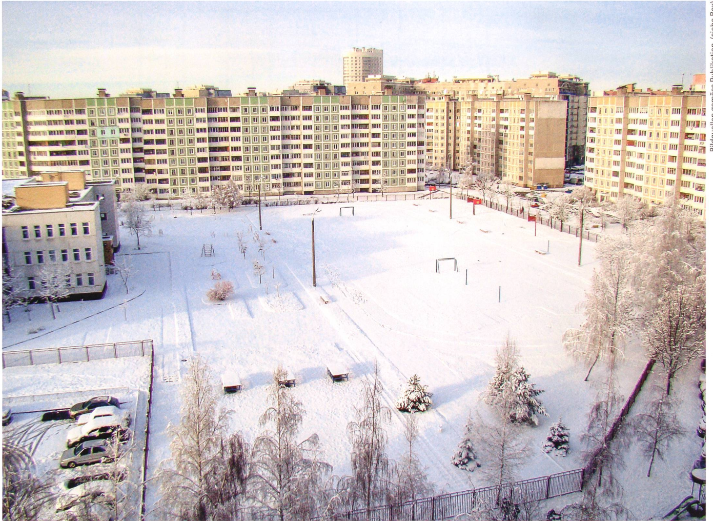
Bildquellen gemäss Publikation (siehe Box)