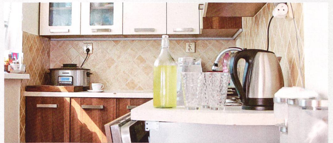
Haus und Familie, Aussicht, Wohnzimmer und Lieblingssort (2017).