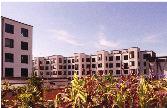
Neubauprojekt der Siedlung "Triemli 1", Baugenossenschaft Rotach