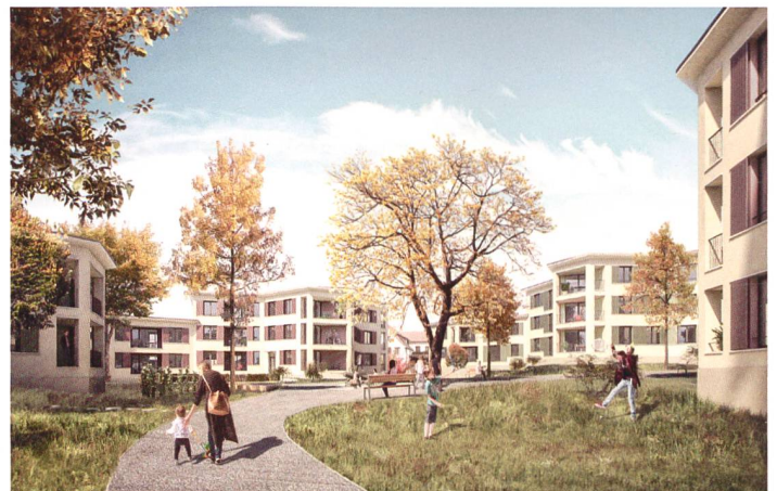
Neubauprojekt "Fiorino", Wohnbaugenossenschaft Linde