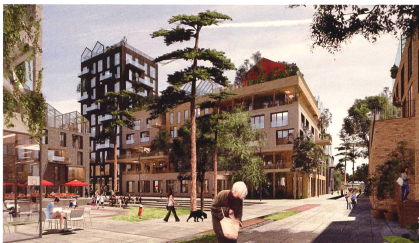
In Oberbillwerder entsteht ein neuer Stadtteil mit 7000 Wohneinheiten und 5000 Arbeitsplätzen. Hier setzt man insbesondere auf das Modell der Baugemeinschaft.

Im Zentrum dieses Modellversuchs steht, dass attraktive Wohnungen mit guter Architektur