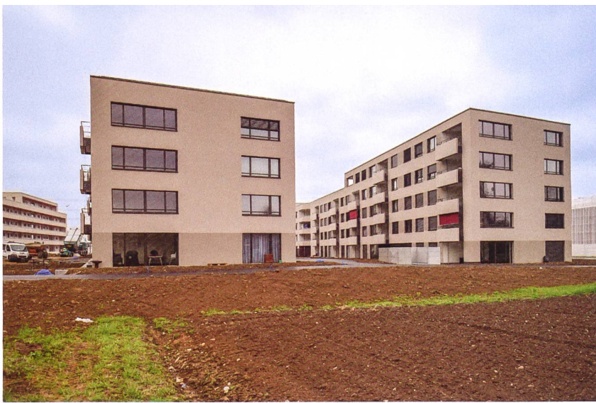
Teilweise wurden die Balkone seitlich verglast, als transparenter Wetter- und Lärmschutz.