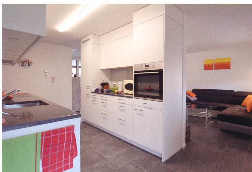
Beim Innenausbau legte die WGL grossen Wert auf Qualität, etwa mit einer Schweizer Küche.