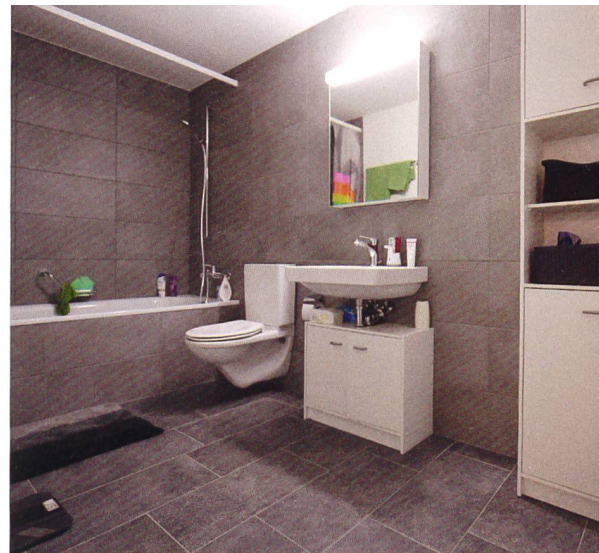
Die 3 1/2- und die 2 1/2-Zimmer-Wohnungen verfügen jeweils über ein Bad/WC beziehungsweise eine Dusche/WC, die 4 1/2-Zimmer-Wohnungen haben zusätzlich ein Gäste-WC.