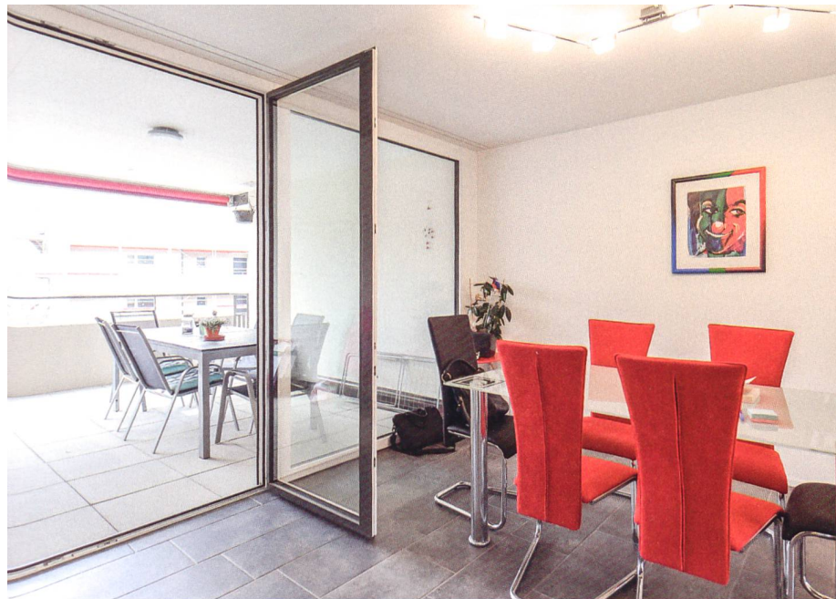
Durch die grosse Fensterfront gelangt viel Licht in die neuen Wohnungen.