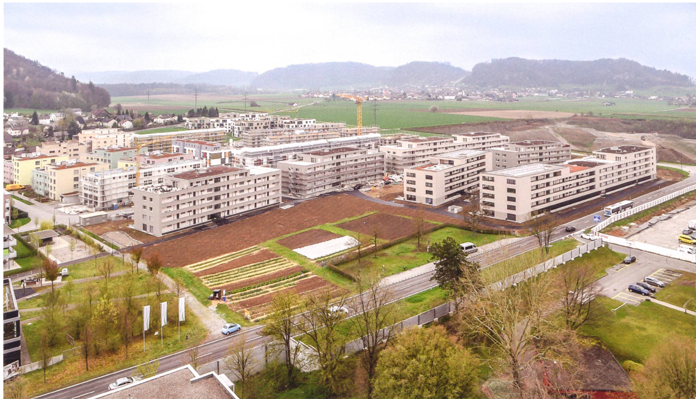
Die neue Überbauung «Lindenblick» mit den zwei Häusern der WGL (rechts vorne, erkennbar an den Photovoltaikmodulen auf dem Dach).

Wohnbaugenossenschaft Lenzburg stellt Neubau «Lindenblick» fertig