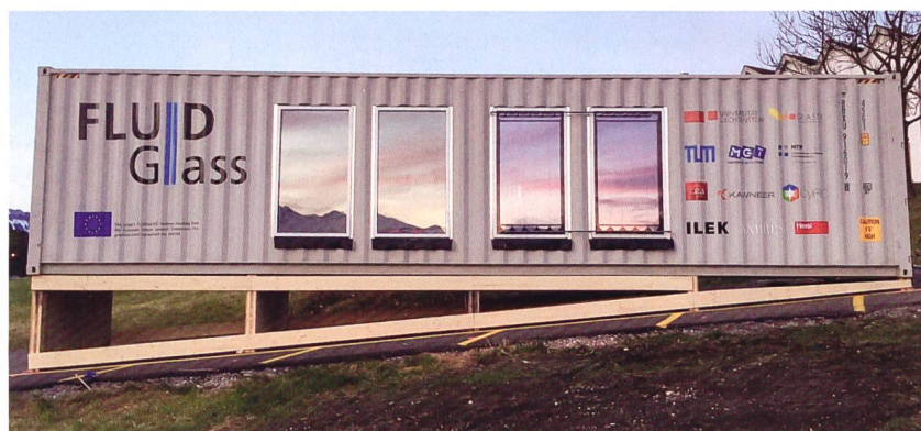
Testcontainer mit Fluidglas. Bei diesem Fenstersystem wird Wasser als flüssiger Speicher eingesetzt; es kann aktiv heizen und kühlen.

Es gibt verschiedene Wege. Ein radikaler Ansatz wäre, dass man jeden Menschen zum Bauern