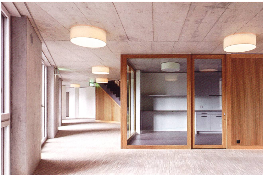
Einblick in die Pflegewohnung.