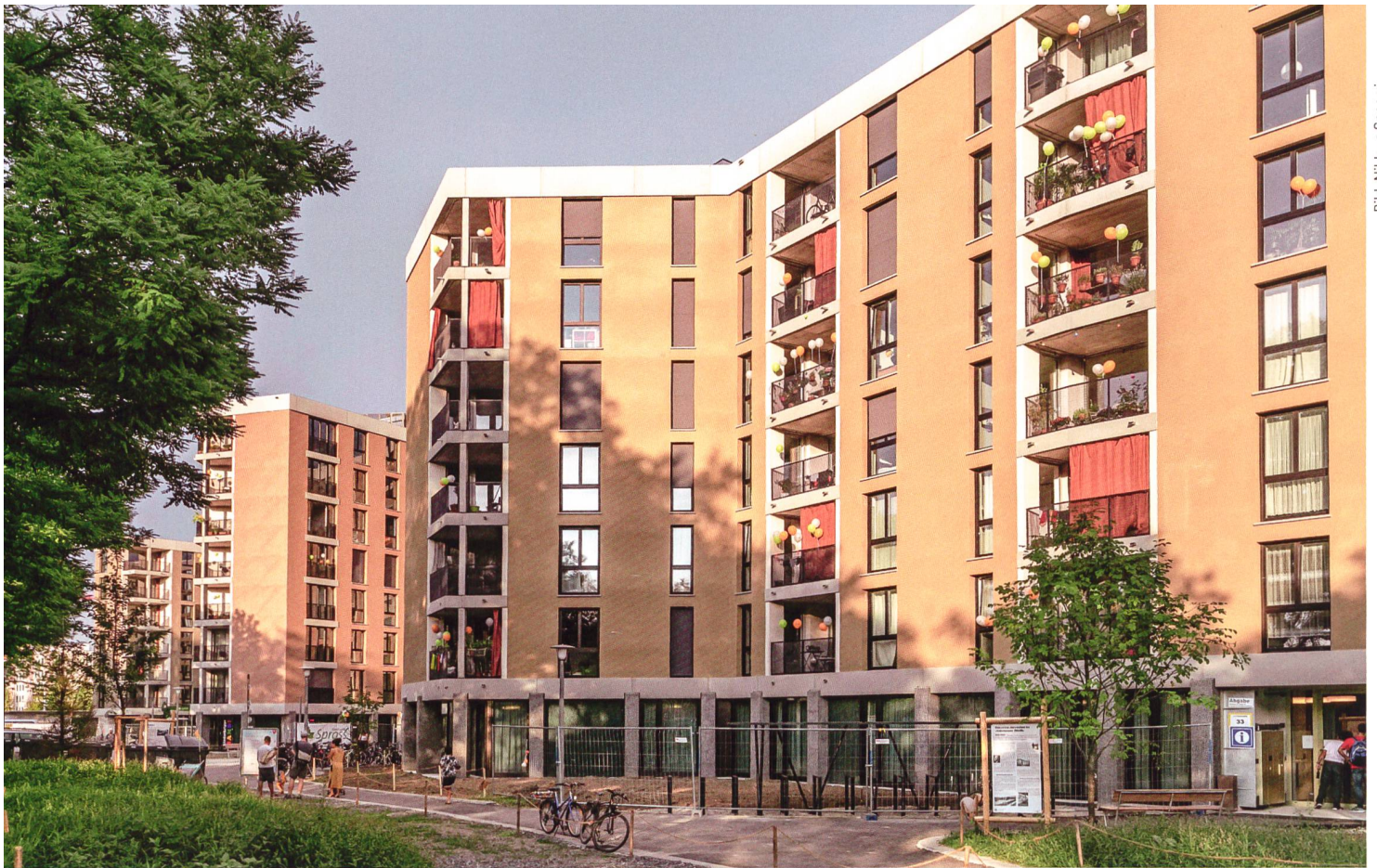
Die Neubauten erstrecken sich entlang dem Letzigraben.