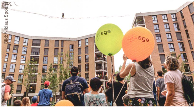
Am 31. August feierte die SGE ihr 75-Jahr-Jubiläum mit einem grossen Fest. Zu bestaunen war auch eine Slackline-Querung zwischen den Neubauten.