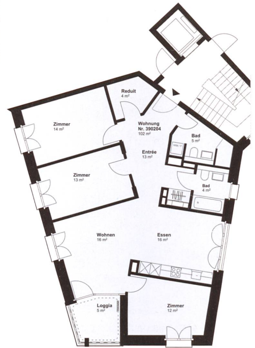
Grundriss einer Viereinhalbzimmerwohnung mit 102 Quadratmetern Wohnfläche.