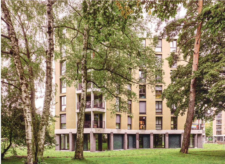
Die Häuser sind in die parkähnliche Umgebung der städtischen Siedlung eingebettet.