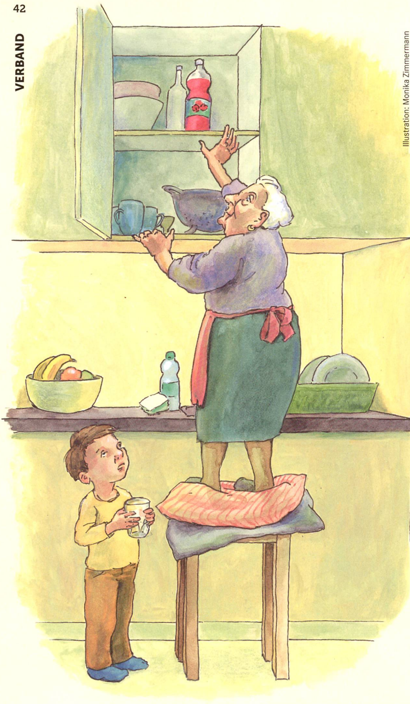
Illustration: Monika Zimmermann

Erwerben Sie mehr Bestellerkompetenz, planen Sie Ihre Sanierungen altersgerecht! Kommen Sie in unseren Kurs am 12. März 2020.