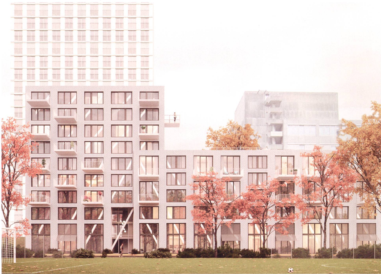
Projekt der Arge Beam für das Baufeld U1 (Baugenossenschaft Aare).