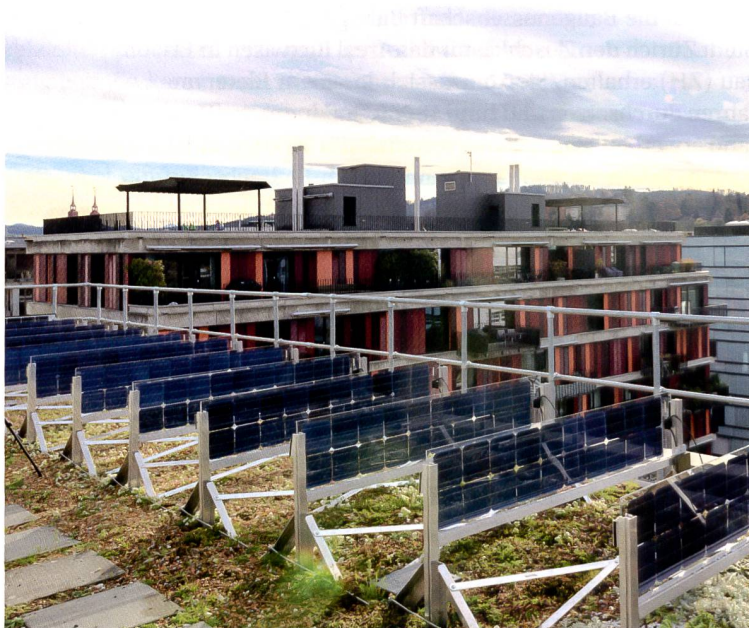
Senkrechte PV-Module und Gründach: die Pilotanlage auf dem Dach der Alterssiedlung Eichgut in Winterthur.

Neben einer besseren zeitlichen Verteilung der Stromproduktion birgt das Konzept weitere Vorteile – allen voran die Möglichkeit der Dachbegrünung. Sie verbessert die Luftqualität, senkt im Sommer die Raumtemperatur der darunterliegenden Gebäudeteile und kann sich sogar positiv auf die Stromproduktion auswirken, wie die ZHAW-Forschenden nun nachweisen konnten. Durch silberlaubige Pflanzen konnte der Ertrag – verglichen mit einem Standard-Gründach – um