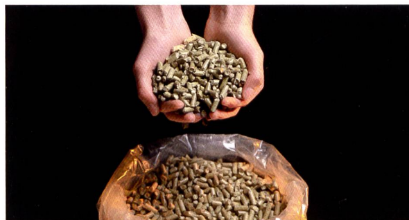
Für die Umstellung von fossiler Energie auf Holz (hier Pellets) stehen neue Fördermittel bereit.

für fossile Treibstoffe. Das Förderprogramm ist für mittlere und grosse Heizungen angelegt. Bereits ein Mehrfamilienhaus mit drei Wohnungen kann substanziell profitieren ( www.ezs.ch/erneuerbarheizen ).