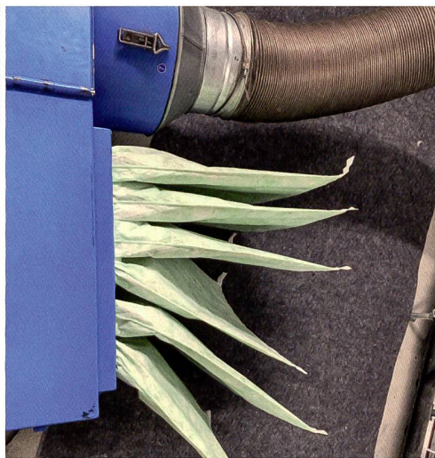
Die Reinigungsmaschine mit frischen Filtern.