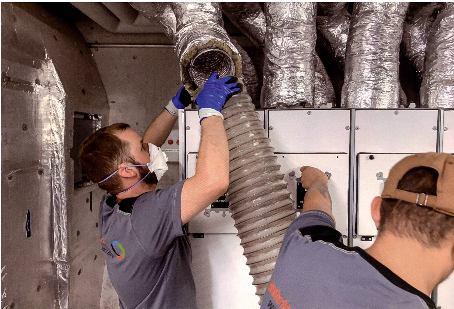
Bei einer professionellen Reinigung der Lüftungsanlagen werden die Ablagerungen in den Rohren abgesaugt und die Filter gewechselt.

Korrektes Einstellen und Warten von Lüftungsanlagen ist in Pandemiezeiten besonders wichtig