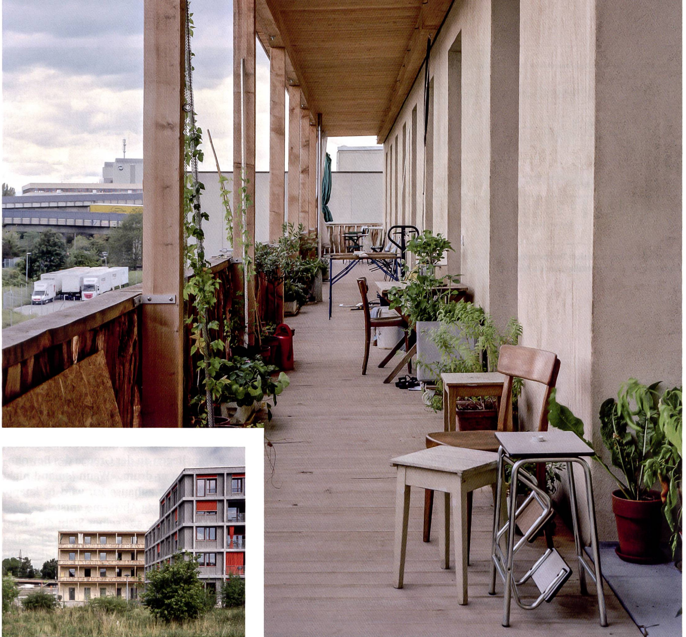
Das Konzept des heizungsfreien Wohnatelierhauses (auf dem kleinen Bild links) basiert auf dicken Mauern und einem reduzierten Fensteranteil. Die Wärme liefern Sonneneinstrahlung, Elektrogeräte, Lichtinstallationen und Menschen.

Das heizungsfreie Wohnatelierhaus der Coopérative d'Ateliers bewährt sich im Betrieb – unter gewissen Bedingungen