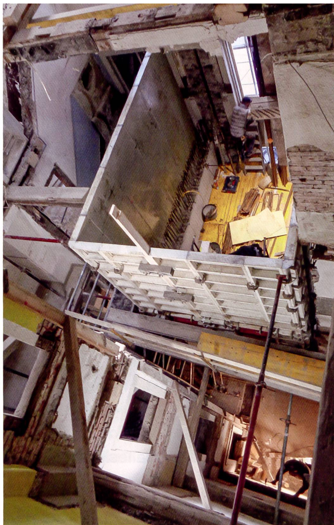
Ein Treppenhaus wurde zugunsten von mehr Wohnraum aufgehoben.

Mehrfamilienhaus Sihlramtsstrasse 15 in Zürich, welches das Juwo 1988 von der Stadt Zürich im Baurecht übernehmen konnte. Dort mussten wegen morscher Holzbalken aus statischen Gründen die Decken saniert werden. Ebenso waren Küchen, Bäder und Elektroinstallationen erneuerungsbedürftig. Das Zürcher Büro a.b.a. architekten entwickelte zunächst verschiedene Varianten, um die notwendige Sanierung mit einer Erhöhung der Wohnplätze zu verbinden.