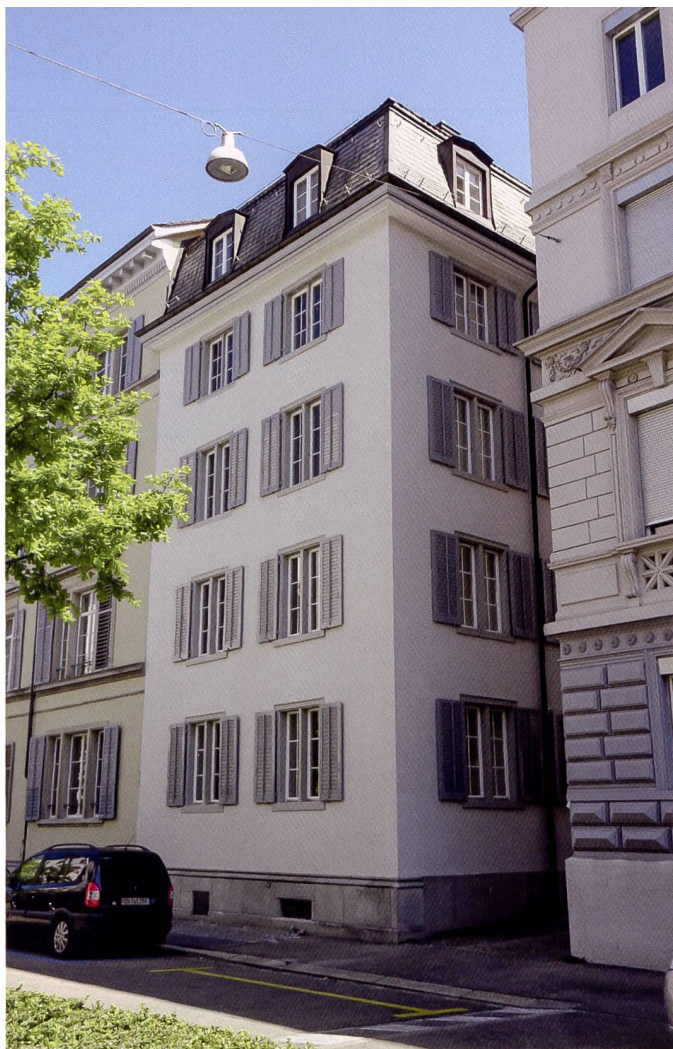
Das Jugendwohnnetz Juwo konnte die Liegenschaft Sihlramtsstrasse 15 von der Stadt erwerben.