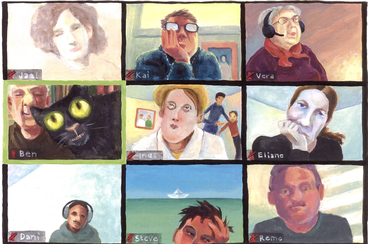
Illustration: Monika Zimmermann

Die Plattform Zoom erlaubt einen regen Austausch zwischen Kursteilnehmenden und Referentinnen und Referenten, nicht nur frontal, sondern auch in Kleingruppen in sogenannten Breakout-Räumen.