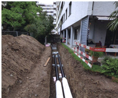
Grabungsarbeiten auf dem Areal Frankental für die neuen Zuleitungen des Energieverbunds.

lichen Beitrag.» Die Gewobag ist entschlossen, diese Strategie konsequent zu verfolgen, wo es machbar ist, auch mit Varianten eines Energieverbundes. Im Quartier Albisrieden sind zum Beispiel seit einigen Jahren rund 660 Wohnungen an einen anderen Verbund angeschlossen; hier stammt die Abwärme nicht von Brauchwasser wie in Höngg, sondern aus einem benachbarten Rechenzentrum. Bereits 2007 hatte die Gewobag ihre Siedlung Giardino ans Wärmenetz in Schlieren angeschlossen. Eine erste Zwischenbilanz zeigt: Während 2008 die Wohnungen der Genossenschaft noch zu über 80 Prozent mit Öl und Gas versorgt wurden, liegen diese Anteile heute bei nur noch 6,2 beziehungsweise 9,6 Prozent. Sobald die Erneuerung derjenigen Siedlungen abgeschlossen ist, die noch mit Öl- und Gasheizungen ausgestattet sind, wird der Anteil Gas auf rund drei Prozent sinken und Öl gänzlich entfallen. In Kürze folgen weitere Projekte mit der umweltfreundlichen Verbundlösung: Voraussichtlich noch diesen Herbst stellt die Gewobag bei den Siedlungen Riedhof und Grünau von Öl beziehungsweise Gas auf Fernwärme um – dies entspricht einer Einsparung von noch einmal rund 340 000 Litern Heizöl pro Jahr.