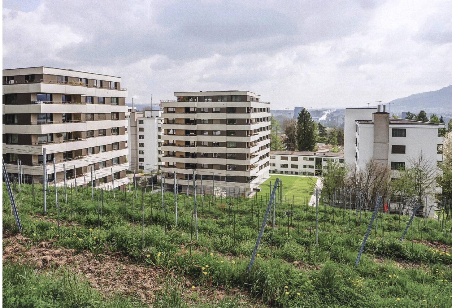
Gewobag-Siedlung Frankental mit 222 Wohnungen in drei Gebäuden aus den 1960er-Jahren. Letztere wurden im Herbst an den neuen Energieverbund Altstetten und Höngg angeschlossen, über den nun die Versorgung mit Warmwasser und Heizwärme erfolgt.

Gewobag setzt Energiestrategie um und setzt dabei auf Verbundlösungen