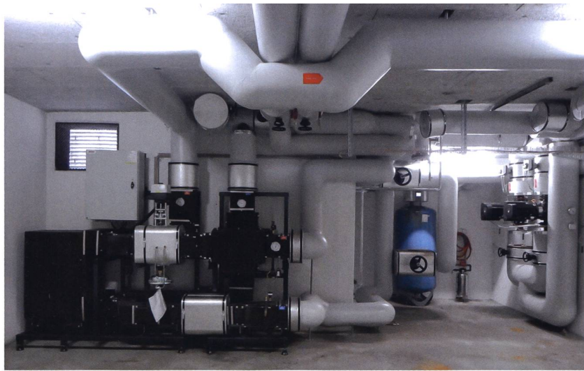
Die neue Wärmeübergabestation (Wärmetauscher) bei der Gewobag.