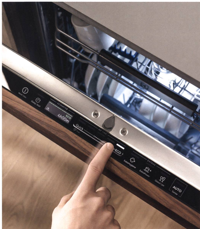
Laufzeit des Spülprogramms bequem per Schieberegler einstellen und Ökologie-Level am Display ablesen.