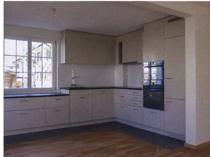
Bei den bestehenden Wohnungen wurden die Grundrisse angepasst und neue Wohnküchen geschaffen. Rechts oben und Mitte: Treppe einer neuen Dachmaisonette und Zimmer.