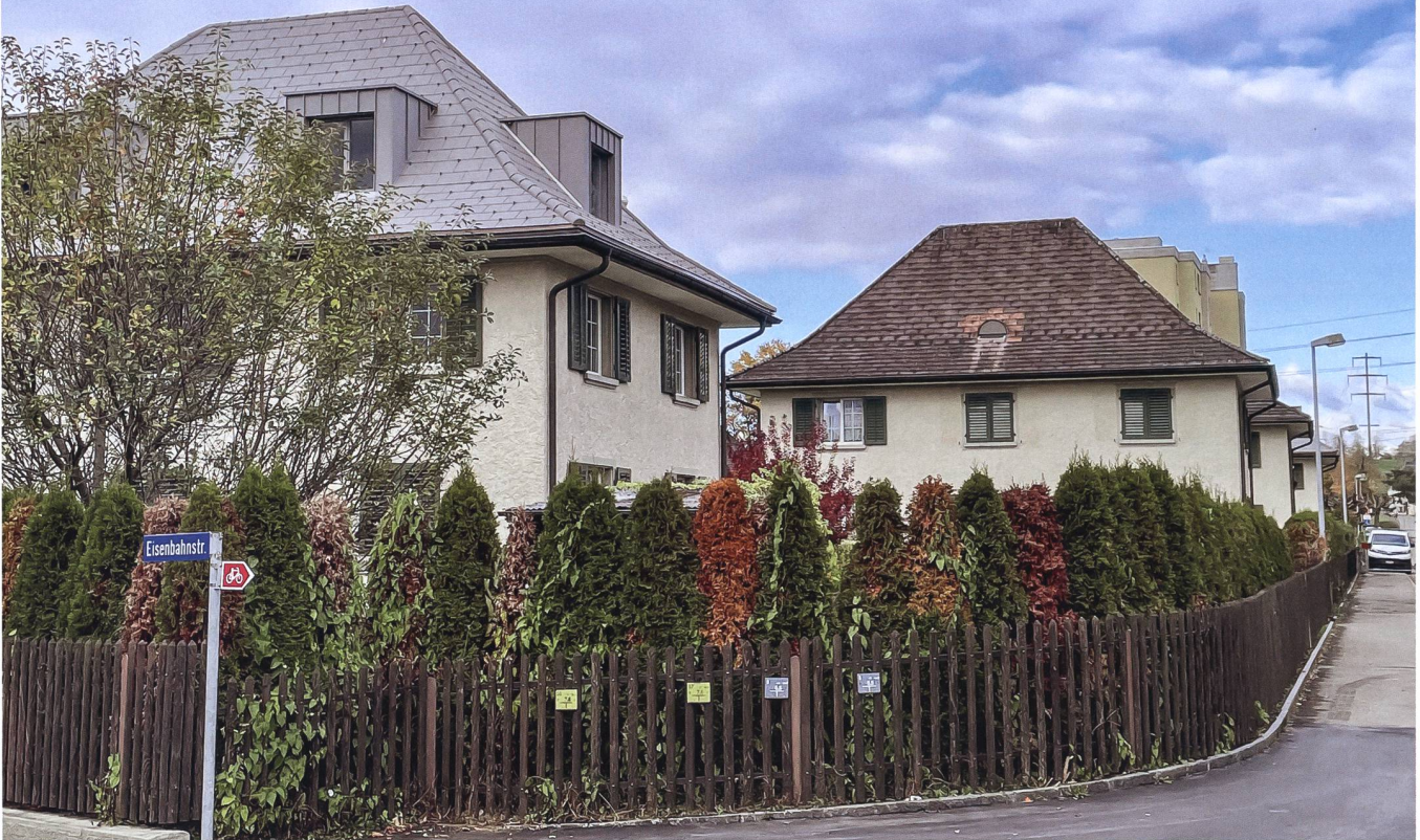
Das Erscheinungsbild der sieben Häuser der EBG Rapperswil im Südquartier verändert sich mit der Sanierung kaum, nur die Lukarnen verraten die neuen Dachwohnungen im vorderen, bereits sanierten Gebäude.

Eisenbahner Baugenossenschaft Rapperswil erneuert ihre denkmalgeschützte Gartenstadtsiedlung