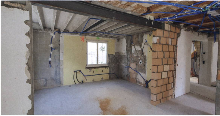
Die Sanierungen erfolgen im unbewohnten Zustand und deshalb etappiert; den Bewohnenden stehen vier Ausweichwohnungen zur Verfügung. Oben Umbau der Wohnküchen, rechts Anlegen neuer Sickerleitungen.