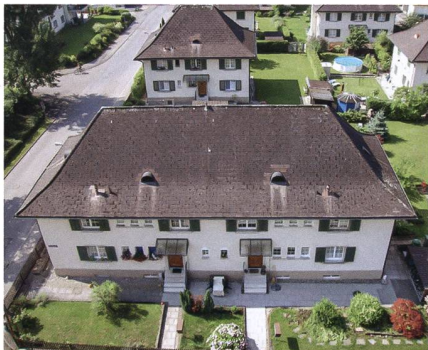
Sieben Einzel- und zwei Doppelhäuser bilden das Gartenstadt-Ensemble. Es steht unter Ortsbildschutz.