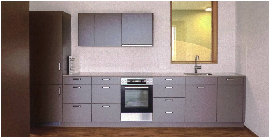
In grossen, gut beleuchteten und anpassbaren Küchen fühlen sich Senioren wohl – etwa in der Siedlungsgenossenschaft Sunnige Hof (oben) oder im Lindenpark Kriens (unten).

Aus ergonomischen Gründen sind die Küchen meist auf einer Linie oder übers Eck angeordnet. Laut Schwitter geht es bei Renovationen oft nicht anders, als die Küche auf weniger Elemente zu beschränken und übers Eck anzuordnen – was arbeitstechnisch kein Nachteil