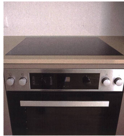
In den Küchen der Gaiwo sind neben den Schubladen auch andere Flächen ausfahrbar. Die Oberschränke sind leicht nach unten versetzt und damit leichter zugänglich, der Kochherd ist mit Drehschaltern anstelle eines Touch-Screens ausgestattet – genauso wie im Lindenpark Kriens (rechtes Bild). Unterfahrbare Spülen hingegen sind nicht standardmässig vorgesehen.