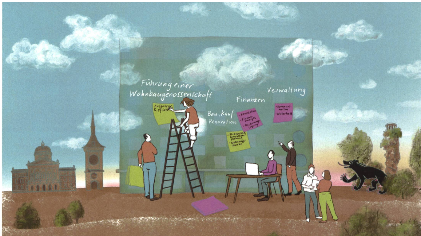
Lehrgang Management von gemeinnützigen Wohnbauträgern – dieses Mal an zentraler Lage in Bern.

Das Weiterbildungsangebot im zweiten Halbjahr 2022