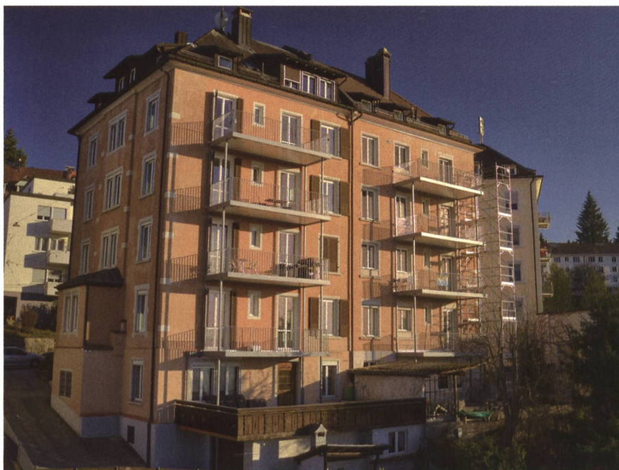
Referenzobjekt St. Gallen – Total 8 Balkone.

tem. Es vermeidet Wasserführungen auf der Nutzfläche, was eine Gefläche ohne Gefälle ermöglicht. Zudem ist das Balkonsystem konstruktiv dicht. Auf unterhaltsintensive Silikonfugen wird verzichtet.