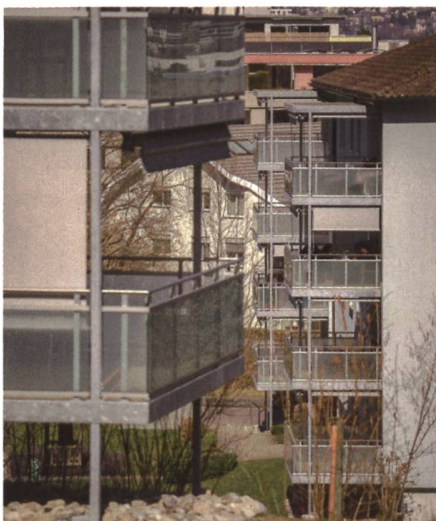
Referenzobjekt Kriens – Total 150 Balkone.

Das mit langjähriger Erfahrung entwickelte Konzept besticht durch innovative Lösungen. Dazu gehört unter anderem das intelligente Entwässerungssys-