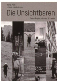
Tanja Polli, Ursula Markus Die Unsichtbaren: Sans-Papiers in der Schweiz 256 Seiten Rotpunktverlag 2021

Etwa 100 000 Menschen ohne geregelten Aufenthalt leben und arbeiten in der Schweiz. Sie putzen, hüten Kinder, arbeiten auf der Baustelle oder im Restaurant, fast immer in prekären Arbeitsverhältnissen. Sans Papiers sind systemrelevant, leben aber in ständiger Angst. Was hat sie dazu bewegt, ein Leben im Versteckten auf sich zu nehmen? Tanja Polli und Ursula Markus holen die Sans Papiers aus ihren Hinterhofzimmern und Kellerwohnungen und porträtieren sie in ihrem Alltag.