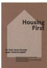
Carlo Fabian et al. (Hrsg.) Housing First: Ein (fast) neues Konzept gegen Obdachlosigkeit 82 Seiten 2020 Online unter www.schwarzerpeter.ch

Im April 2019 haben der Verein für Gassenarbeit Schwarzer Peter, die Schweizerische Gesellschaft für Sozialpsychiatrie und die Stiftung Pro Mente Sana eine Tagung zum Thema Housing First organisiert. Um ihre Ideen und Erkenntnisse einem breiten Fachpublikum zugänglich zu machen, wurden die Beiträge in einer Publikation gesammelt. Sie beschäftigen sich mit verschiedenen Aspekten des Themas und sollen Wege aufzeigen, wie gute Angebote aussehen können.