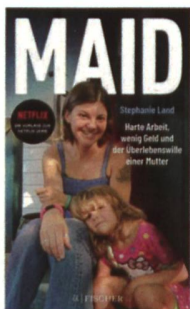
Stephanie Land Maid 368 Seiten Fischer Verlag 2022

«Maid» ist die wahre Geschichte hinter der gleichnamigen Netflix-Serie, die mit Margaret Qualley, Andie MacDowell und Nick Robinson verfilmt wurde. In ihrer Biografie erzählt Stephanie Land vom Überlebenskampf für sich und ihre Tochter, die ihre ersten Schritte in einem Obdachlosenheim machte. Land war mit ihr aus einer toxischen Beziehung auf die Strasse geflohen und schaffte es schliesslich, sich aus der Armut zu befreien. Heute ist sie Journalistin und Bestsellerautorin.