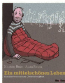
Kirsten Boie, Jutta Bauer Ein mittelschönes Leben. Ein Kinderbuch über Obdachlosigkeit 28 Seiten Verlag Hinz & Kunzt 2021

Kirsten Boie und Jutta Bauer packen ein schwieriges Thema an, vor dem sich viele fürchten: Was bedeutet es, wenn man alles verloren hat, was einem wichtig ist? Erzählt wird die Geschichte eines Mannes, der ein normales Leben führt. Dann verlässt ihn seine Frau und nimmt die Kinder mit. Bald bricht seine Welt auseinander, der Mann landet auf der Strasse. Ergänzt wird die Geschichte durch Informationen und Fragen, die Kinder an Obdachlose gestellt haben.