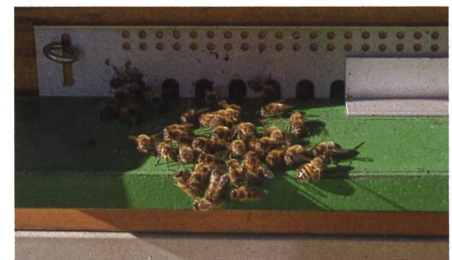
... sowie fünf Bienenvölker.