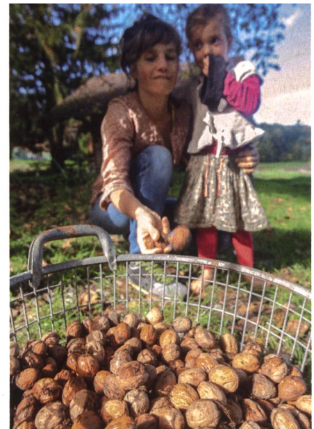
Ein alter Nussbaum gehört ebenso zum Hof wie Obstbäume und Sträucher ...