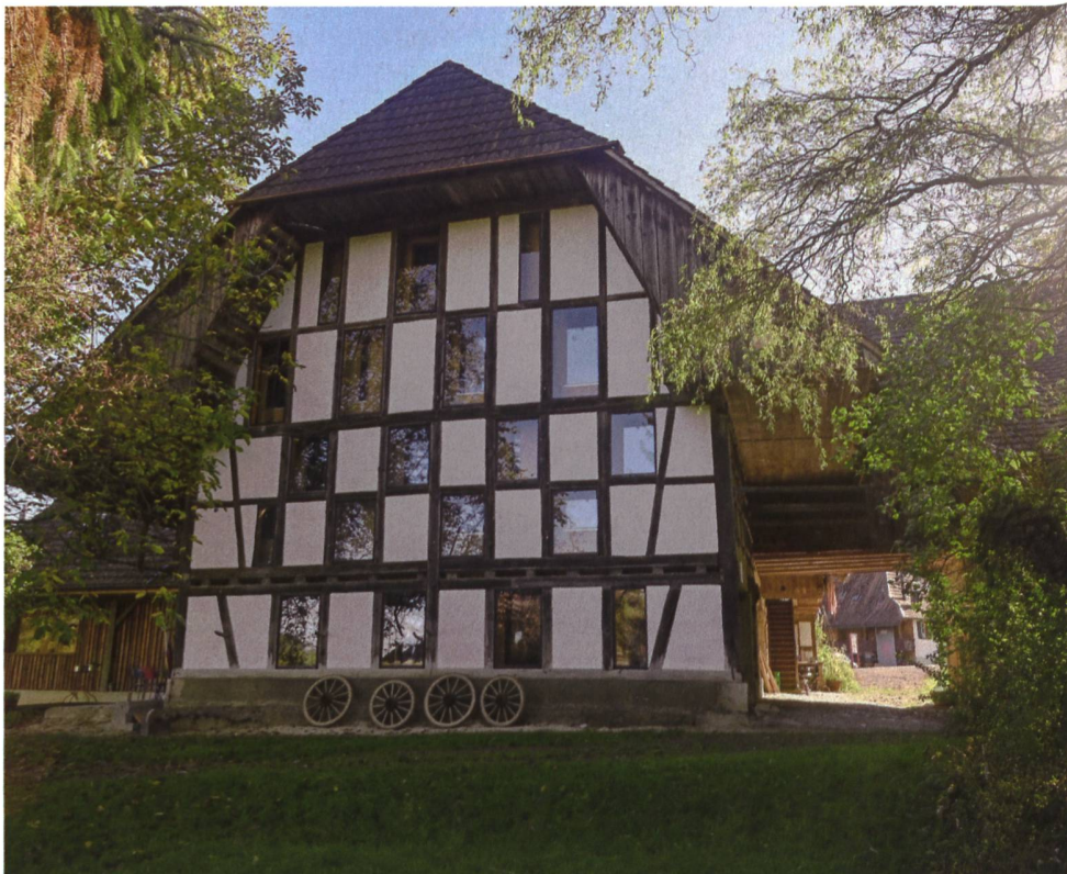
Der Umbau des ehemaligen Bauernhauses erfolgte nach baubiologischen Kriterien. Bei den Arbeiten haben die Genossenschaftsmitglieder selbst Hand angelegt.