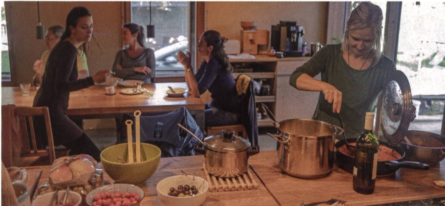
Essen in der Gemeinschaftsküche.