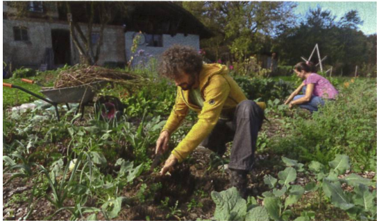
Der Garten wird gemeinsam bewirtschaftet. Zur Selbstversorgung reicht es aber (noch) nicht.

garten. Dieser ist als Mandala-Beet angelegt, ein Klassiker der Permakultur. Bei den kreisförmig angeordneten Beeten wird darauf geachtet, dass sich Stark- und Schwachzehrer Jahr für Jahr verschieben, also Pflanzen wie Tomaten, die dem Boden viele Nährstoffe entziehen, und solche wie Nüsslisalat, die wenig Nährstoffe brauchen. Innerhalb der Beete mischen sich beispielsweise Kohlrabi oder Peperoni mit Kräutern und Blumen, die Schädlinge abhalten und Nützlinge fördern. «Einige von uns haben Permakulturrkurse be-