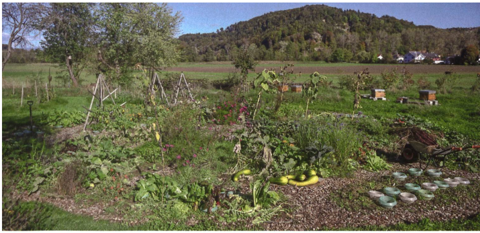
Die Beete sind kreisförmig angeordnet; Pflanzen, die dem Boden Nährstoffe liefern, wechseln sich ab mit solchen, die ihm Nährstoffe entziehen.