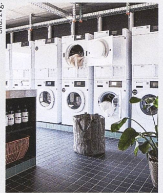
Alle Hausgeräte der Firma Schulthess stammen aus Wolfhausen im Zürcher Oberland.