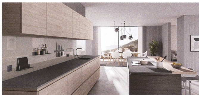
Gewürze, Kräuter und Tablet an die Wand. Die magnetischen Küchenrückwände von Schmidlin verleihen der Küche eine neue Perspektive.

Die Küchenrückwände von Schmidlin sind aus glasiertem Titanstahl gefertigt und daher sehr robust und praktisch. Das überzeugt im täglichen Einsatz. Denn