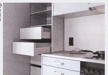
Die Firma Forster fertigt ihre langlebigen Stahlküchen in Arbon am Bodensee.