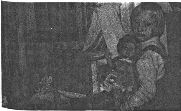
sollten Mädchen sich auf ihre Puppen konzentrieren...