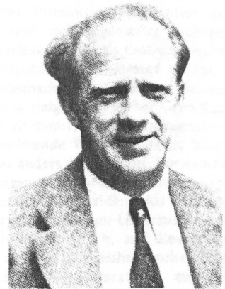
Werner Heisenberg (als Gefangener 1945)

setzungen relevant werden: Die technischen Verwertungsbedürfnisse auf der einen und die ideologischen auf der anderen Seite. Es wäre wichtig, die einzelnen Machtfaktoren in der Auseinandersetzung um die Ideologie der Physik hier einzuordnen und damit diese Entwicklung auf die Gesamtgeschichte der Machtverhältnisse und Zielbestimmungen im System zurückzuführen. Aber Ideologie wird auch in den Schulen vermittelt und in der Publizistik, Wehrphysik im Schulbuch und utopische Romane sind Beispiele. Außerdem hat die ideologische Auseinandersetzung um die Physik lange vor 1933 begonnen. Die Physik im Faschismus kann nicht behandelt werden, wenn nur die Zeit 1933 - 1945 betrachtet wird und wenn nur die akademische Physik im Blickfeld ist.