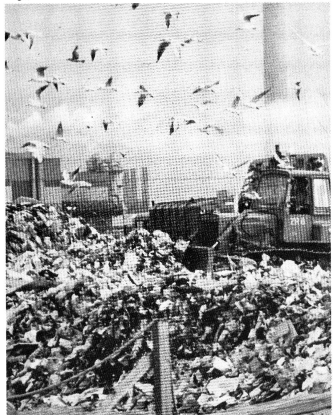
Müll: Rohstoff der Verschwendungsgesellschaft

Auch wenn wir erkennen, daß diese Forderungen im Moment nur Stückwerk sind, und ihnen die Frage nach dem Wert von Plastiktüten und privaten Automobilen sicher nicht zu Grunde liegt, können sie in der Diskussion um Atomstrom und Ver-