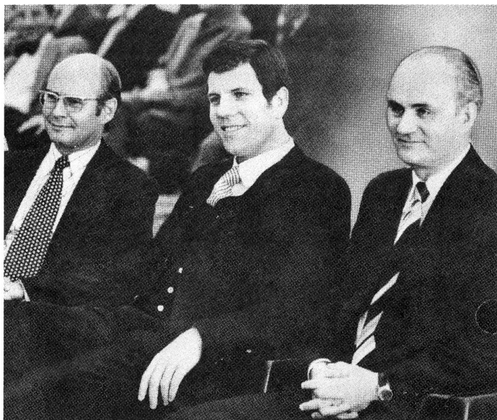
Haunschild, Hauff und Matthöfer, die Humanisierungspolitiker

verschlechternden Arbeitsbedingungen unternommen wird und keine Notwendigkeit für selbstorganisiertes kollektives Handeln besteht. Den Arbeitenden wird eingeredet, daß Staat und Wissenschaften sich ihrer Interessen angenommen haben und diese stellvertretend für sie durchsetzen. Zugleich lenken die Maßnahmen des Programms von den zu bekämpfenden Ursachen der Verschärfung der Arbeitssituation ab. Die Ursachen werden im Programm erst gar nicht thematisiert und untersucht. Mit den in den Projekten des Programms fabrizierten Verbesserungsvorschlägen werden den Arbeitenden Lösungen präsentiert, die die schlimmsten Auswüchse abmildern und eine entscheidende Änderung ihrer Situation nur vorspiegeln. Es wird den Arbeitenden Hoffnung gemacht, daß sich ihre Situation im Rahmen der herrschenden gesellschaftlich-ökonomischen Verhältnisse durchschlagend verändern läßt.