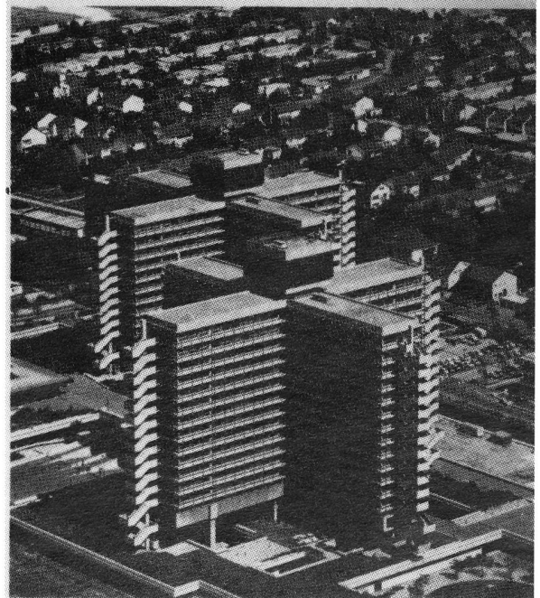
Eine Information des Bundesministers für Forschung und Technologie