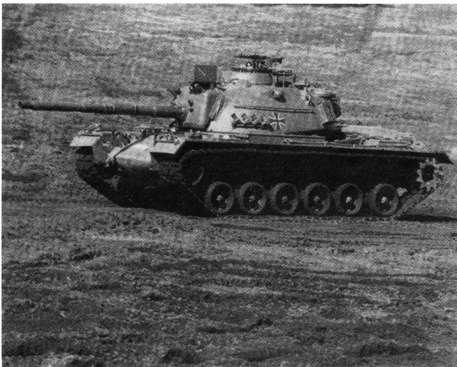
18,9% für die Wehrforschung

Für den Politikbereich des Bundesministeriums für Forschung und Technologie (BMFT) heißt Projektförderung vor allem wirtschaftsbezogene Forschungsförderung. Privatwirtschaftliche Forschungsarbeit enthält aus der Projektförderung einen