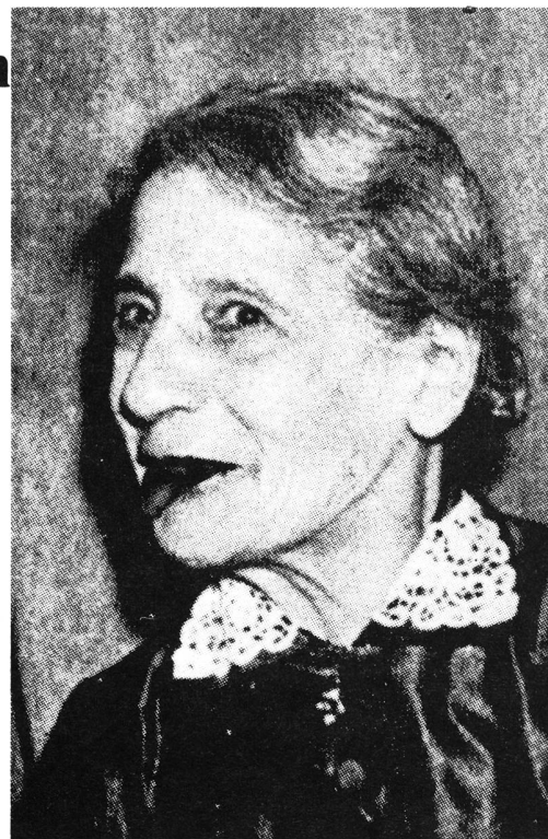
... das ließ sich Lise Meitner nicht bieten ...