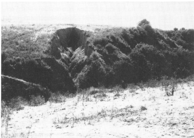
Erosion in Nordchina

Im Zuge der Ausweitung des Han-Reiches wurden so die fruchtbaren Einzugsgebiete der großen Flüsse und die große Lößhochebene vollständig entwaldet. Die Folgen waren: Abtrag von Bodenmaterial (Erosion) – verstärkter Oberflächenabfluß – Wassermangel in Dürreperioden – Ablagerung von Sedimenten im Mündungsgebiet der Flüsse – Überschwemmungen. Während in Zeiten politischer Stabilität von der Zentralgewalt riesige Wasserbauarbeiten vorangetrieben wur-