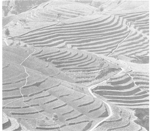
Terrassenfelder im Lößhügelland am Gelben Fluß

Während nach der chinesischen Revolution von 1949 die Waldfläche wieder von 8% auf 13% gesteigert werden konnte – eine für ein Entwicklungsland nahezu beispiellose Leistung –,