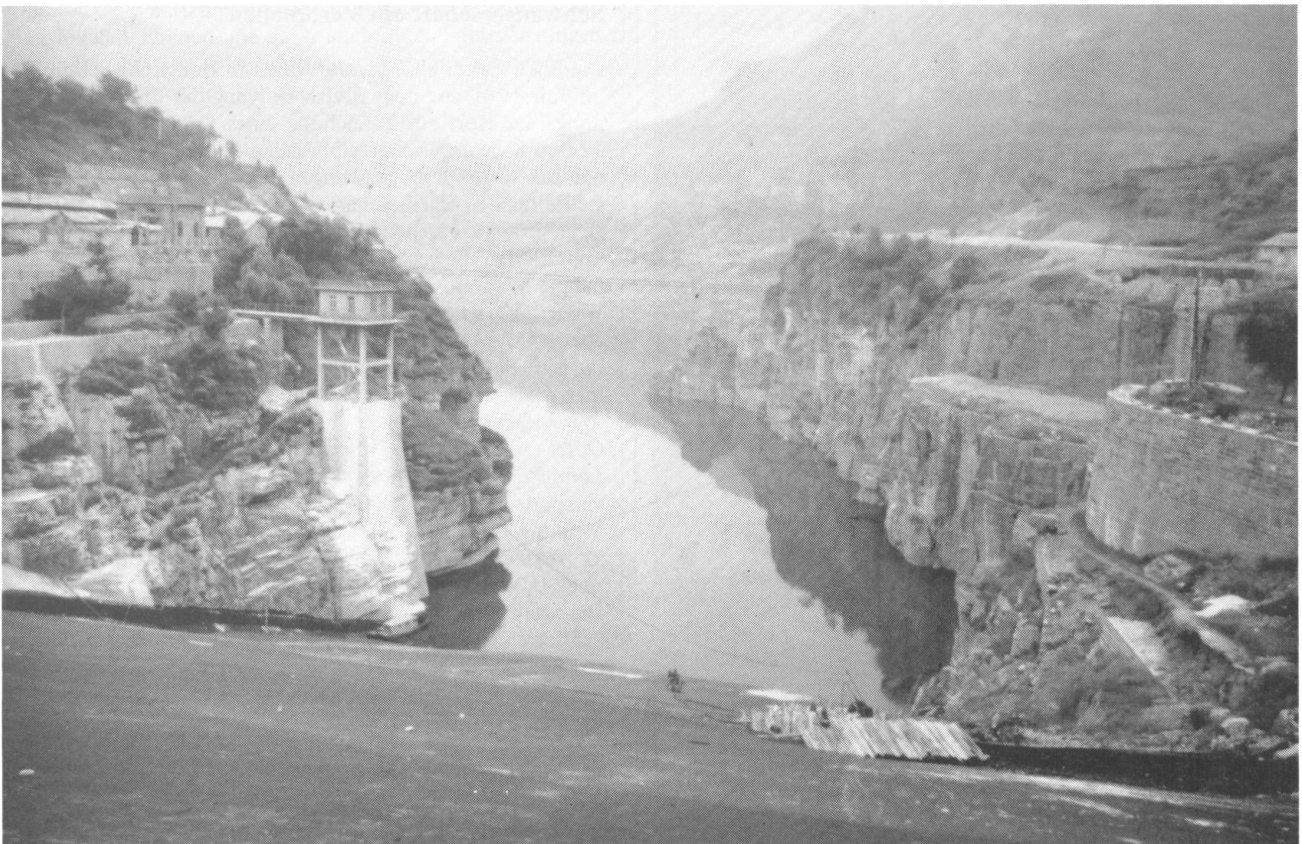
Talsperre Nangudong, Lin Xian in Henan, mit 75 Mio m 3 Inhalt, 1958 erbaut und 1975 durch Überspülen schwer beschädigt

Dort hatte man allerdings die Landwirtschaft längst kollektiviert, während in China 1955 erst 14% der bäuerlichen Haushalte Produktionsgenossenschaften (LPG) des „niederen Typs“ (mit durchschnittlich 25 ha Ackerland) angehörten. Deshalb erforderten auch die kleinsten Bewässerungsvorhaben eine umständliche staatliche Koordination und langwierige Ver-