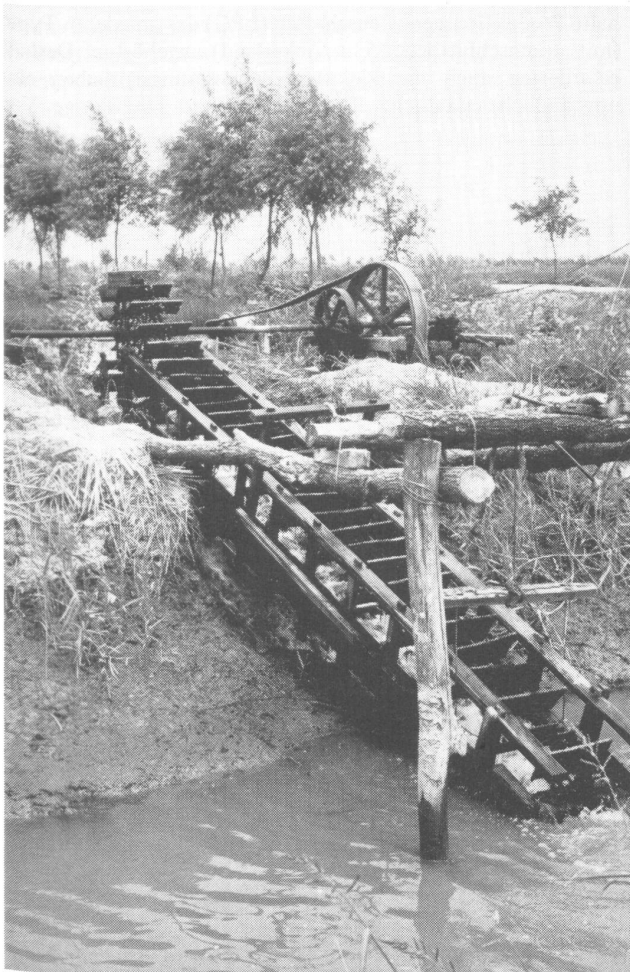
„Chinesisches Drachenrad“ oder „Wasserleiter“, nachträglich mit Elektromotor ausgerüstet

Der landwirtschaftliche Wasserbau und insbesondere die Bewässerung waren in den vergangenen drei Jahrzehnten eine Art „Schlüsseltechnologie“ zur Intensivierung des Ackerbaus in China und spielten eine entsprechend zentrale Rolle in den Entwicklungskonzepten seiner politischen Führer. Rückblickend lassen sich deshalb am Beispiel der Bewässerung verschiedene reale Widersprüche bei der Kollektivierung und Mechanisierung der Landwirtschaft „entschlüsseln“, die sich in den ideologischen Linienkämpfen der Vergangenheit (und Zukunft!) spiegeln. Ein „richtiger“ Entwicklungsweg ist heute jedoch schwieriger anzugeben als vor 30 Jahren, weil die rapide gewachsene Bevölkerung – wie in vielen anderen Entwicklungsländern – die natürlichen Ressourcen in mancher Hinsicht bereits überfordert.