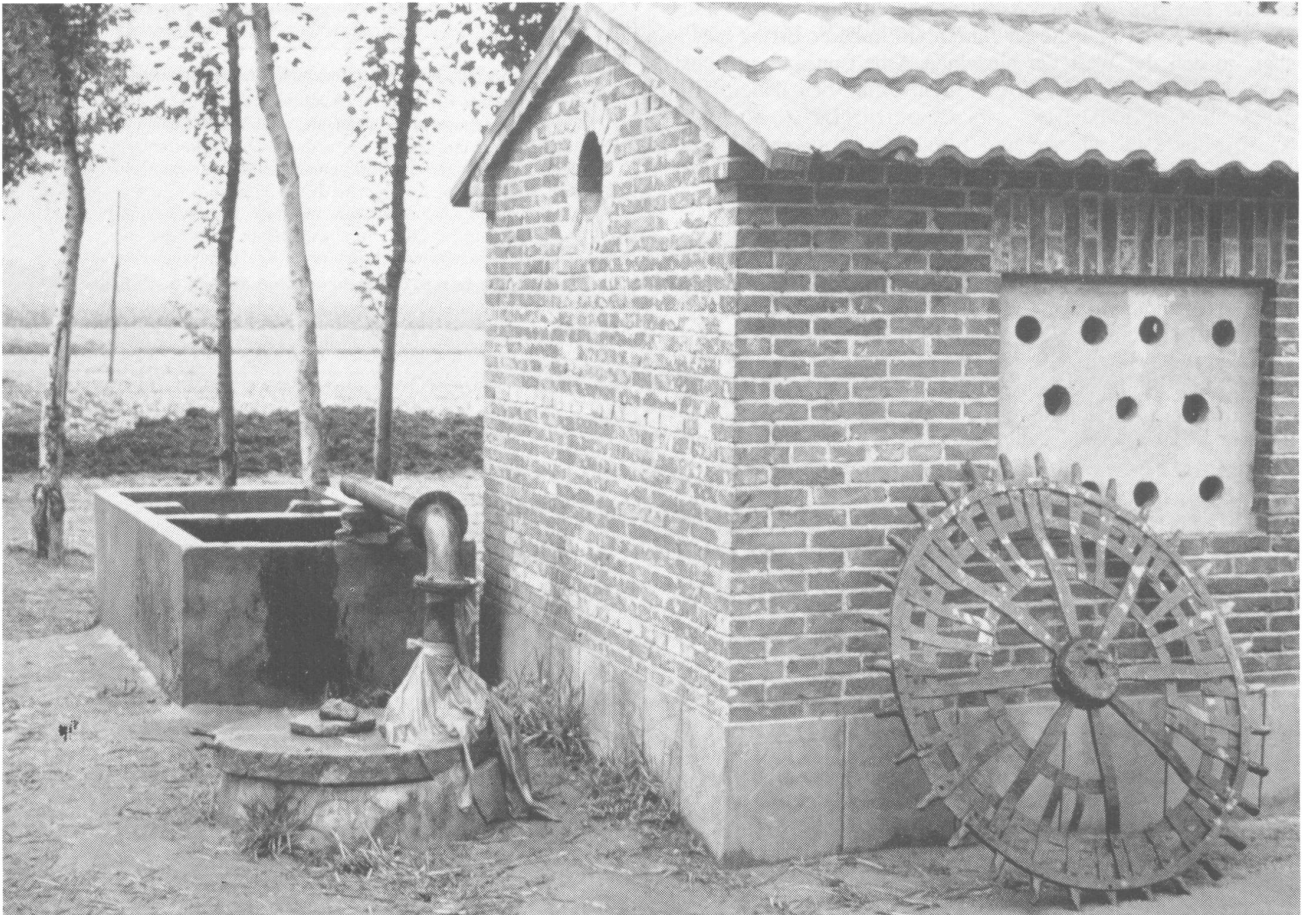
Brunnen mit Pumpenhaus, Bezirk Shijiazhuang in Hebei, mit altem Antriebsrad einer Paternosterpumpe

Nachdem der Zugviehbestand bis 1955 schnell gewachsen war, führten Protest- und Notschlachtungen (vgl. Zeittafel) dazu, daß man an vielen Brunnen die von Pferden, Kamelen, Maultieren und Eseln angetriebenen Schöpfräder durch „Paternosterpumpen“ ersetzen mußte. Diese wurden meist über Pedale oder Schwinghebel von den Bauern selbst in Gang gehalten, die über diesen „Fortschritt“ sehr geflucht haben dürften. Dennoch gelten die Paternosterpumpen als Modellbeispiel einer „angepaßten“ Technologie. Sie konnten aus örtlichen Materialien in einfachen Werkstätten hergestellt werden, sogar in derart großer Zahl, daß allmählich der Grundwasserspiegel absank, was das Pumpen immer beschwerlicher machte. Deshalb begann man ab 1964 damit, Brunnen mit Motorpumpen auszurüsten, und ersetzte seit 1966 die flachen Schachtbrunnen durch weniger, aber tiefere Bohrbrunnen.