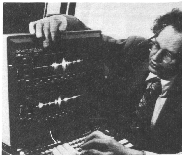
Sprachanalyse bei IBM

Bedeutet schon der enge Frequenzbereich des Telefons eine gewisse Restriktion, nämlich Filterung von Kommunikation, so gilt dies in weiterem Maße für die Digitalisierung, die nur in Zeitsprüngen und Meßwertquanten überträgt. Hier gehen dann z.B. Betonung, Satzmelodie und Satzrhythmus, also die emotionale Komponente, weitgehend verloren, wenn z.B. bei der Frequenzkodierung nur die bedeutungstragenden Hauptfrequenzen dargestellt werden. Die Wortwahl bei Einzelworterkennen ist genau festgelegt, bei der Aussprache ist starke Konzentration erforderlich, die Wörter sind voneinander abgehakt und folgen nach im EDV-System festgelegten Reihenfolgen. Der Dialog mit der Computer-Sprachausgabe ist standardisiert, die menschlichen Antworten sind genau festgelegt. Der Computer dirigiert den Menschen sowohl im Takt als auch im inhaltlichen Ablauf des Kommunikationsdialogs. Mit menschlicher Kommunikation hat das wenig zu tun. Von dem schönen Wort, daß sich der Computer dem Menschen anpaßt, bleibt nur noch, daß die Anpassung des Menschen an den Computer erleichtert werden soll. Auch ungeschulte Benutzer müssen rankönnen, und dann halt über Telefon oder Mikrofon. Im Arbeitsprozeß werden die letzten Reserven des Arbeiters auch noch aktiviert. Benutzt er schon Hände, Augen und weitere Muskelkraft, um zum Beispiel Pakete zu sortieren, so werden jetzt Sprechorgane und Gehör zusätzlich bei der akusti-