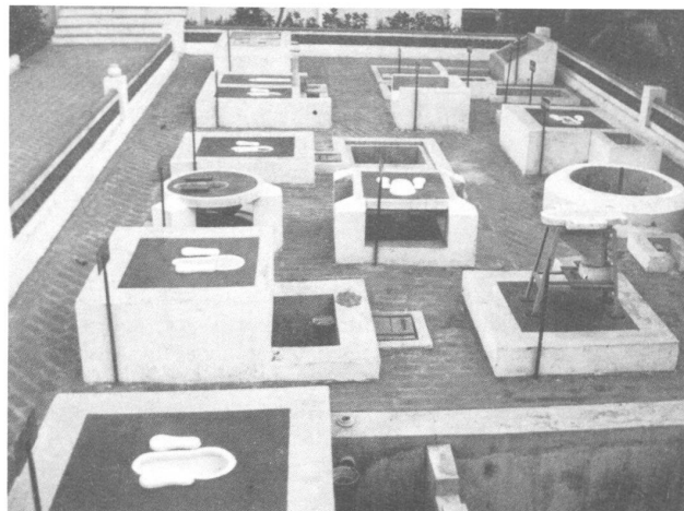
Demonstrationsanlagen, die in regional unterschiedlichen Projekten eingesetzt werden: Toilette ist nicht gleich Toilette.

Die Anschauung dieser wie auch anderer Projekte bringt die Erkenntnis, daß, auch wenn die Methoden technisch besser entwickelt gewesen wären, die Projekte zu einem Mißerfolg geführt hätten. Die Technologie ist ökologisch, nicht aber sozial angepaßt. Ihr Einsatz ist im wesentlichen makroökonomisch motiviert: Devisen- und Energieeinsparung, Erweiterung