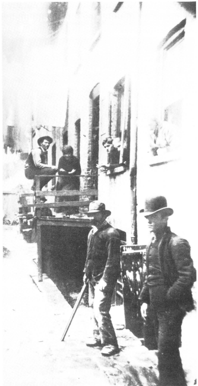
„Schlupfwinkel für Ganoven“

Zugleich boten die Eugeniker eine Lösung für das größte Problem an, mit dem sich das britische Establishment damals konfrontiert sah. Es fürchtete zu dieser Zeit nicht die Arbeiterklasse als ganze, sondern die Arbeitslosen und Gelegenheitsarbeiter der großen Städte. Diese Schicht galt, im Gegensatz zu den ‚ehrbaren‘ Arbeitern, als politisch unzuverlässig, zum Aufruhr geneigt, geistig minderwertig und physisch degeneriert. Diesem „Bodensatz“ wurden die Mißerfolge im internationalen