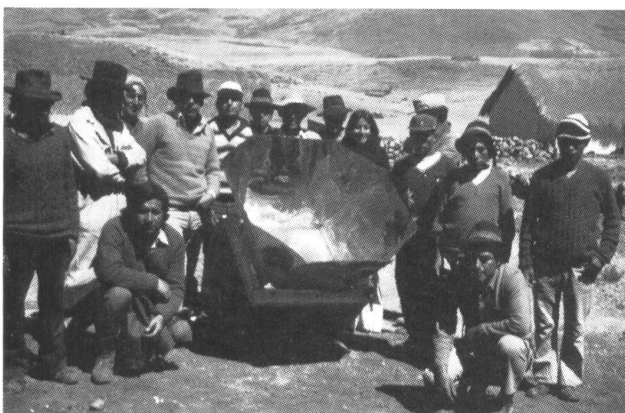
Solaröfen – nützlich, aber für die Bauern in den Anden kaum bezahlbar

sen, aber auf der anderen Seite scheint uns auch wenig auf eine naheliegende politische Veränderung hinzuweisen.