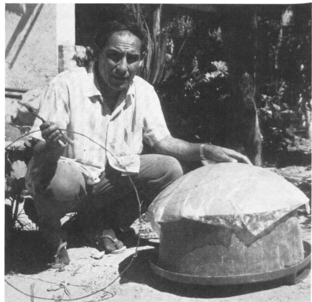
Der Autor mit einer zur Alkoholdestille umgebauten Plastikschüssel

Das Geld war das erste Problem. Das zweite: Wenn man als Professor aufs Land geht und zu den Leuten spricht, erreicht man meist nur zwei, drei Familien. Da wir mehr Leute erreichen wollten, und somit eine Organisation benötigten, wendeten wir uns an den Staat. Aber dann stellten wir fest, daß der Staat keine Anstrengung unternahm, ja, sich sogar gegen uns wendete. Nachdem wir auf eigene Faust weitermachten und unseren Solarkocher vor 100, manchmal aber auch vor 1000 oder gar 3000 Leuten vorgeführt hatten, wartete bei unserer Rückkehr vom Land die Polizei schon auf uns. Sie verhörten uns auf dem Revier, beschuldigten uns der Agitation und behinderten uns auf vielfältige Weise. Die Probleme wuchsen, und wir kamen zu dem Punkt, wo uns klar wurde, daß wir uns auf die tieferen politischen Probleme unseres Landes einlassen müssen. Die Technologie kann die Situation in unseren Ländern nicht ändern. Neue Technologie wird ein Nebenprodukt der politischen Veränderungen sein. Das läßt sich leicht an einem Beispiel demonstrieren: Nehmen wir Indien. Dort sind