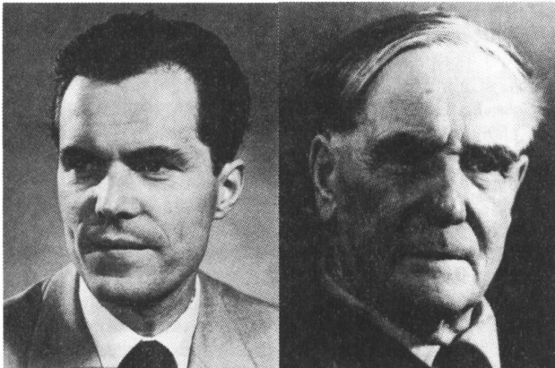
Rudolf Mössbauer, Piotr Kapitza „Nur wenn zwei Russen unterschreiben“

„Wir wissen, daß jede weitere Aufrüstung und immer komplizierter werdende Waffensysteme die Wahrscheinlichkeit für menschliches und technisches Versagen vergrößern. Wir wissen auch, daß ein Atomkrieg nicht nur als Unglück über uns kommen kann: Viele Wissenschaftler in West und Ost sind heute damit beschäftigt, ihn bis ins Detail zu planen. Nach UNO-Angaben arbeiten 25 % aller Wissenschaftler direkt oder indirekt für Rüstungszwecke.“