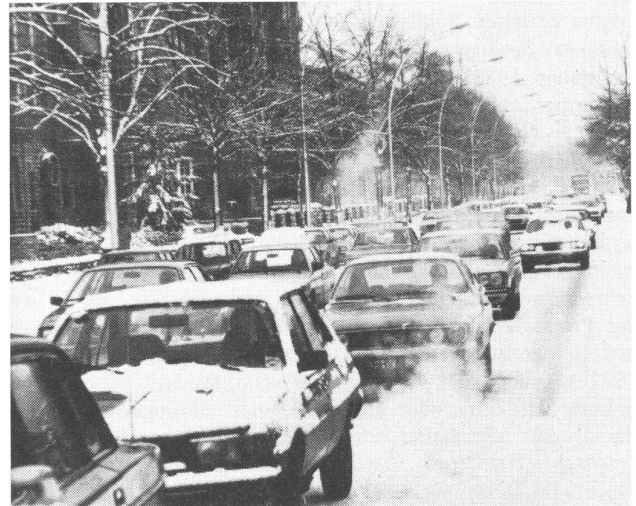
Zwischen diesen beiden Fotos liegen 24 Stunden. Noch am Mittwoch hatten sich die Autoschlängen über den vereisten Hohenzollerndamm gequält (oben). In der Nacht zu Donnerstag wurde Salz gestreut. Deshalb hatten die Autos gestern auf dem Kudamm (unten) wieder freie Fahrt.

Aus den wenigen Beispielen wird wohl ersichtlich, wie undramatisch von Polizei und Presse Tage gesehen werden, die zwar außerordentlich viele Verunglückte fordern, ansonsten aber den Individualverkehr ungehindert rollen lassen. Auch hohe Sachschadenzahlen schrecken nicht und werden, wie die Zahl der Verunglückten, erst gar nicht registriert. Ganz anders an den Tagen mit Winterglätte. Hier hat die Polizeipressestelle die von ihr registrierten genauen Unfallzahlen auf Abruf parat, die Presse kann sich bedienen, und tut dies meist korrekt, von den Boulevardzeitungen abgesehen, die die Polizeizahlen je nach Stimmung mit einem Chaos-Faktor zwischen zwei und drei multiplizieren. Tage mit Winterglätte sind die einzigen im