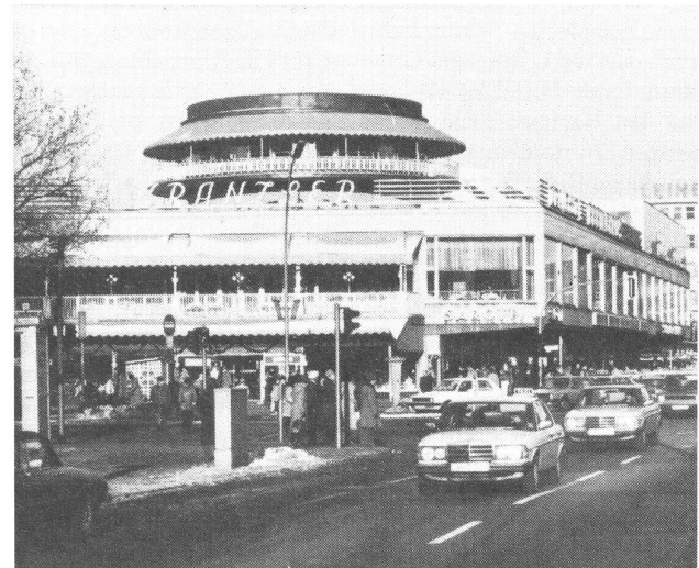
Aus: Bildzeitung Berlin vom 11.12.1981.

Der Witz: Der Kurfürstendamm wurde an diesem Tag nicht gesalzen.