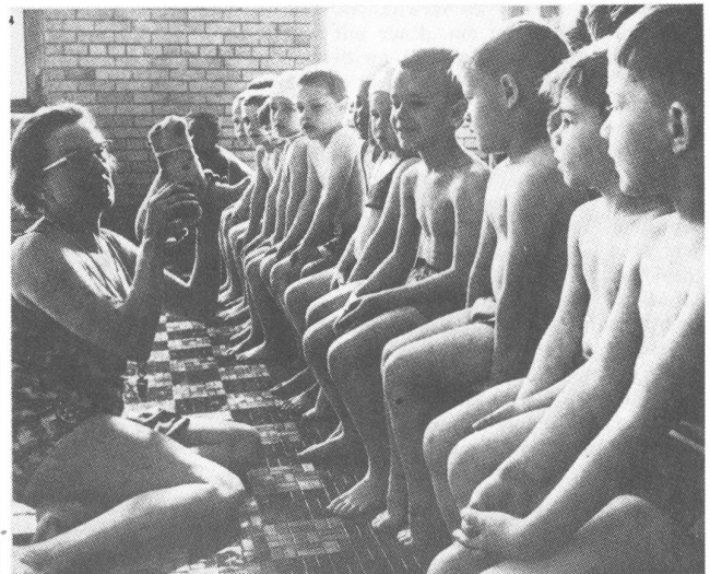
WW-Redaktion bei Einstimmung auf die Frauenfrage.

Die Themen der geplanten Schwerpunkte der nächsten Hefte passen zu diesem Programm und wohl auch zum Jahr 1984. Im Februar können auch wir uns den Gedanken an Orwell nicht verkneifen und werden etwas über Manipulation und Kontrolle und den Widerstand dagegen bringen. Im Mai sind dann die GRÜNEN (und andere Alternative) dran, nach deren Theorie und Praxis zu Wissenschaft und Technik gefragt werden soll. Im August geht es um „Sackgassen“ und „Anpassung“ von Technologien. Im November schließlich ist „Landwirtschaft“ das Thema.