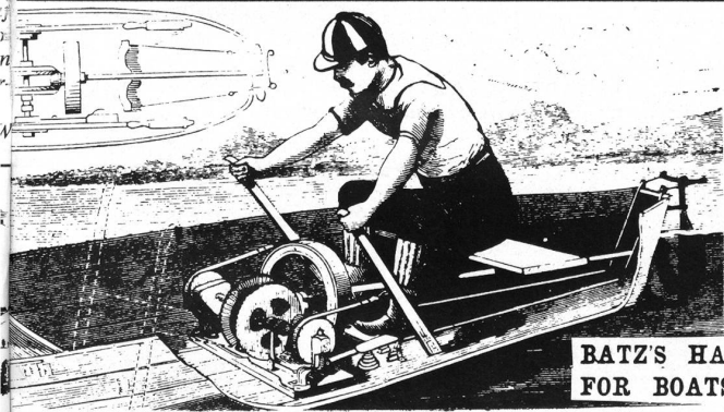
BATZ'S HAND PROPELLER FOR BOATS.

Diese Aktion wird unterstützt von IZG, Deutsche Zündholzfabriken, Mannheim und ihren Handelspartnern.