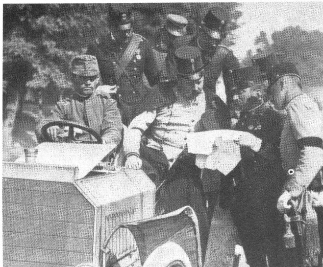
Ingenieur, Konstrukteur, Unternehmer und ein Diener vieler Herren – Ferdinand Porsche. Hier chauffiert er in einem von ihm selbst konstruierten Benzin-Elektromobil den 1914 bei Sarajewo erschossenen Erzherzog Franz Ferdinand. Gut zwanzig Jahre später wird er im Auftrage Hitlers nach amerikanischem Muster die Produktionsanlagen des Volkswagenwerkes entwerfen, mit denen dann auch der gleichfalls von ihm konstruierte Wagen gebaut wurde.

Der Weg von der Einzelfertigung in der Werkstatt zur hochmechanisierten und dann prozessorgesteuerten Produktion war noch weit, schnellaufende, spezialisierte Bearbeitungsmaschinen noch nicht in Gebrauch. So wurden 1907 bei Opel nur zehn Wagen am Arbeitstag montiert, ein Kotflügel(!) benötigte noch acht Stunden Bearbeitungszeit von Hand – 1926 wurden daraus unter Einsatz der Kniehebelpresse von Schuler 10 Sekunden. Dann war Geschwindigkeit nicht mehr allein ein Kennzeichen des Produkts sondern vor allem des Produktionsablaufes.