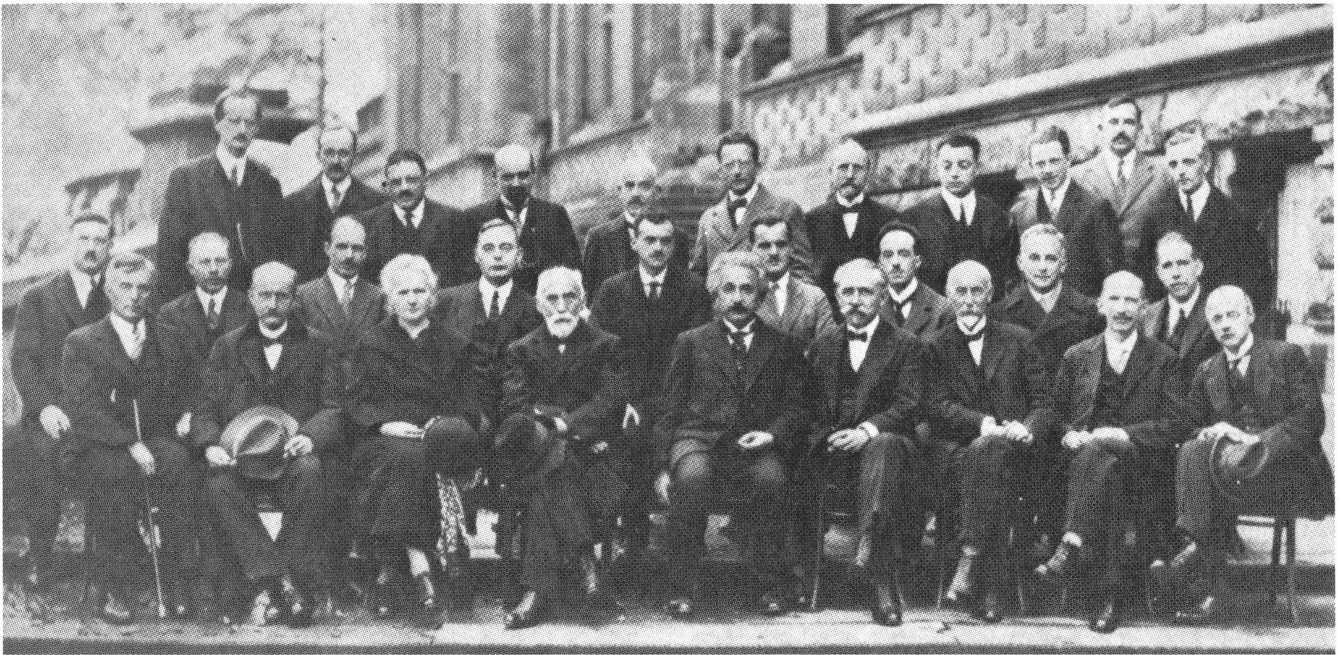
Solvay-Konferenz vom 24. bis 29. Oktober 1927 in Brüssel: 1. Reihe v.l.: Planck (2.), Curie (3.), Lorenz (4.), Einstein (5.), Langevin (6.); 2. Reihe v.l.: Dirac (5.), Compton (6.), de Broglie (7.), Born (8.), Bohr (9.); 3. Reihe v.l.: Schrödinger (6.), Pauli (8.), Heisenberg (9.)

wirkender Zusammenhang existiert, und der Physiker darf gerade nicht danach fragen, weil das nicht Gegenstand der Physik mehr ist.“ Ganz im Gegenteil sagen sie, ist es Aufgabe des Physikers, sich zu überlegen, wie solche Effekte als Bestandteil und im Rahmen der Physik verstehbar sind. Und diese Effekte zeigen ja gerade, daß zwischen den Teilchen, wenn sie weit entfernt sind, nicht das pure Nichts ist, sondern irgendein Medium, das die Fernwirkung in physikalisch verstehbarer Weise überträgt.