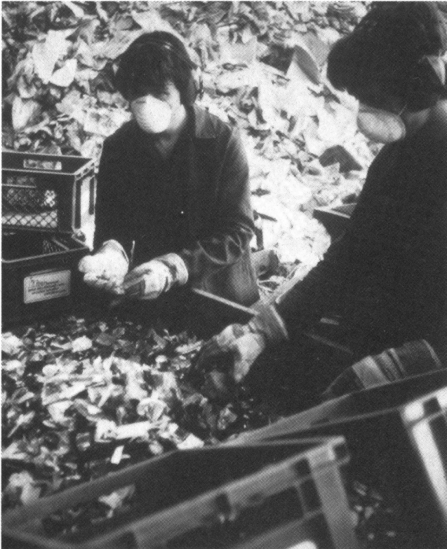
Sortieren von Altglas